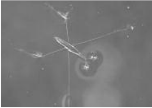
그림 9. 왕소금쟁이 / G. elongatus (Uhler, 1896)]