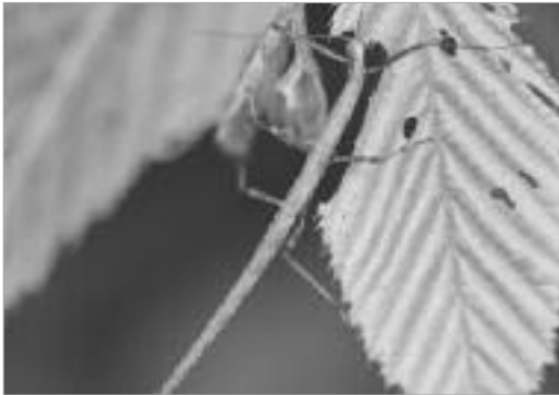
그림 13. 긴수염대벌레 / P. illepidus (Brunner von Wattenwyl, 1907)