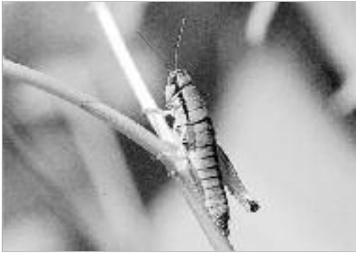
그림 15. 팔공산밑들이메뚜기 / A. beybienkoi Rentz et Miller, 1971