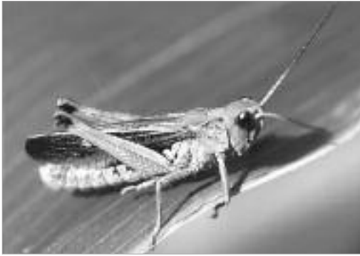
그림 6. 한라애메뚜기 / G. hallasanus Strozhenko et Paik, 2007]