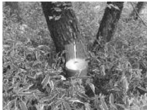
2-3. UV bucket light trap