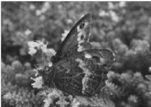
그림 4. 산골뚝나비 / E. autonoe (Esper, 1781)

천연기념물과 환경부 멸종위기종 I 급인 곤충은 산골뚝나비 [ E. autonoe (Esper, 1781)] 1종으로 해발 1800m 이상에서 관찰되었다(표1, 그림 4. 참조).