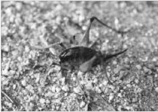
그림 12. 검정꼭등이 / P. ussuriensis Storozhenko, 1990