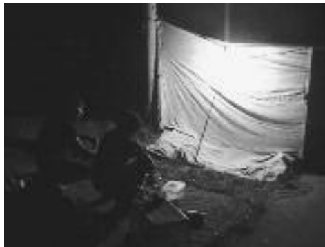
2-2. 발전기를 이용한 야간채집