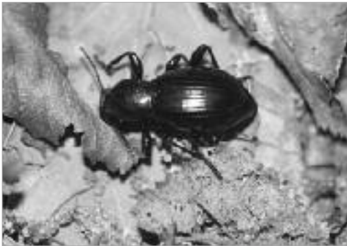
그림 7. 제주호리병거저리 / M. chejudoensis Chûjô et Imasaka, 1982]