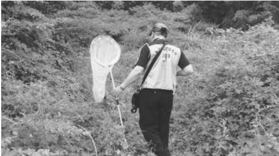
2-1. 포충망을 이용한 채집

한편 조사지역의 문헌기록을 정리하였으며, 또한 제주특별자치도민속자연사박물관, 한라수목원, 국립수목원, 서울대학교, 순천대학교, 성심여자대학교에 소장되어 있는 표본을 검경하여 정리하였다.