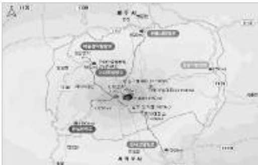
그림 1. 성판악 부근의 조사지역

현지조사는 2012년 5월부터 10월 말까지 성판악등산코스를 대상으로 야외조사를 하였다(그림 1. 참조).