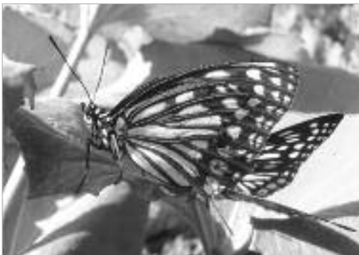
그림 17. 홍점알락나비 / H. assimilis (Linnaeus, 1758)

acrobrunella Park, 1992] 1종 등 총 6목 15과 22종이었다(표 1. 참조).