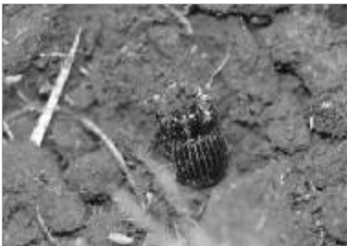
그림 5. 애기뿔소뚝구리 / C. tripartitus Waterhouse, 1875

천연기념물과 환경부 멸종위기종 I 급인 곤충은 산골뚝나비 [ E. autonoe (Esper, 1781)] 1종으로 해발 1800m 이상에서 관찰되었다(표1, 그림 4. 참조).