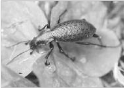
그림 16. 홍단딱정벌레 / D. smaragdinus Von Waldheim Fischer, 1824