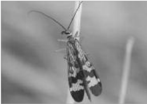
그림 10. 제주밀드리 / P. approximata Esben-Petersen, 1915]