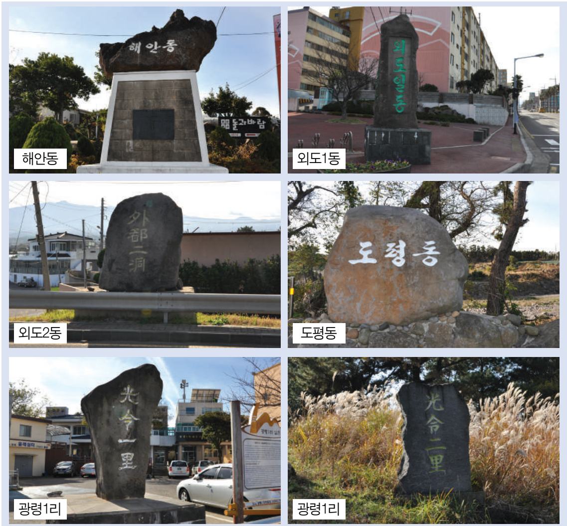
그림 2. 마을별 표지석