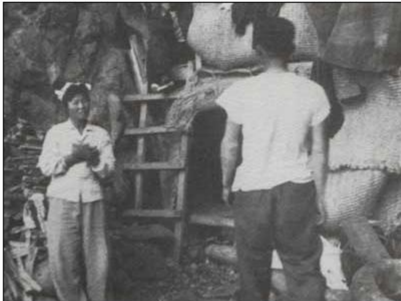
▲ 제주 해녀들은 2~3개월간 지속된 미역 조업을 위해 서도의 동굴에 생활 근거지를 마련했다.

독도행에는 전문적인 모집원들이 있었다. 많게는 40명 적게는 20명 내외의 사람들이 독도에 들어간 것으로 확인된다.