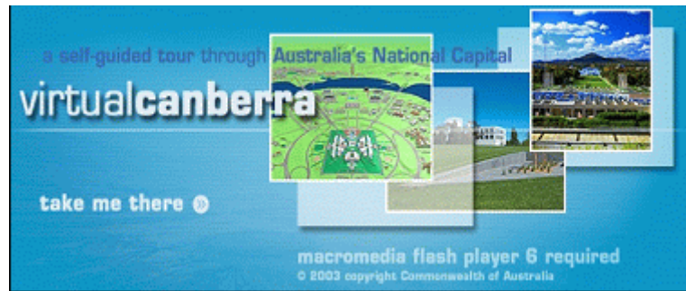
[그림 VI-2] 호주 캔버라시 가상관광 홈페이지 초기화면