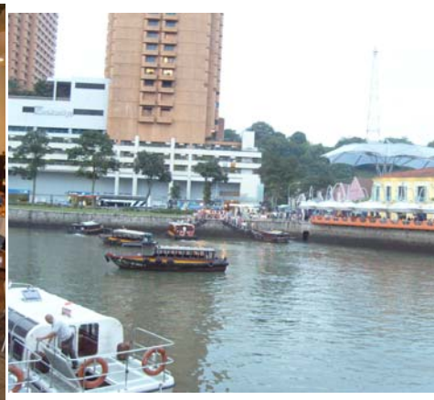
싱가포르 강변 목선