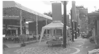
[그림 III-4] 태국 치앙마이 야시장 야시장 전경

자료 이영주, 태국의 재래시장·야시장 운영현황과 속초시예의 시사점, 강원광장, 78호, 강원발전연구원, 2007.