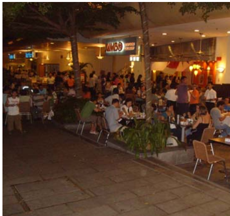
리버사이드 포인트 점보식당