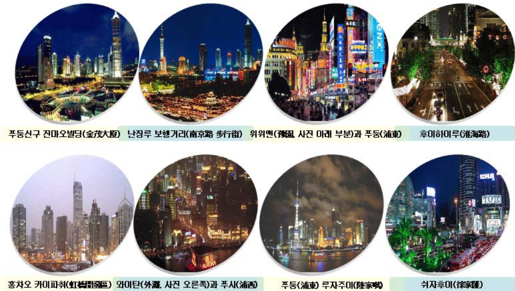
[그림 III-1] 중국 상하이 야간경관조명 사례