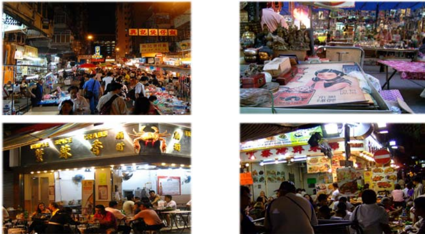
[그림 Ⅲ-2] 태국 템플 스트리트 야시장 전경