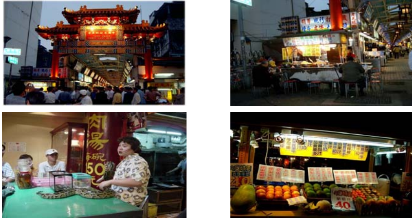
[그림 III-5] 대만 스린 야시장과 화시지에 야시장 전경

먹거리의 특색을 한층 높여주며, 밤이 되면 뱀을 잡거나 뱀싸움을 보여주는 공연을 하기도 함.