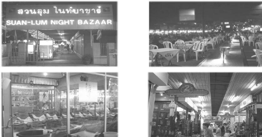
[그림 III-3] 태국 수완룸 나이트바자야시장 전경

자료 : 이영주, 태국의 재래시장·야시장 운영현황과 속초시예의 시사점, 강원광장, 78호, 강원발전연구원, 2007.