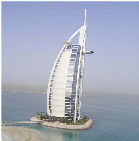
[그림 4-11] 버즈 알 아랍 호텔 전경