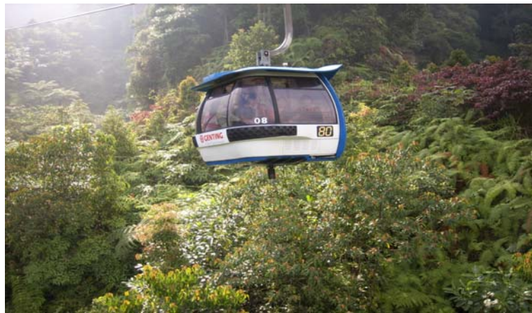
[그림 5-1] 겐팅하일랜드의 스카یره일