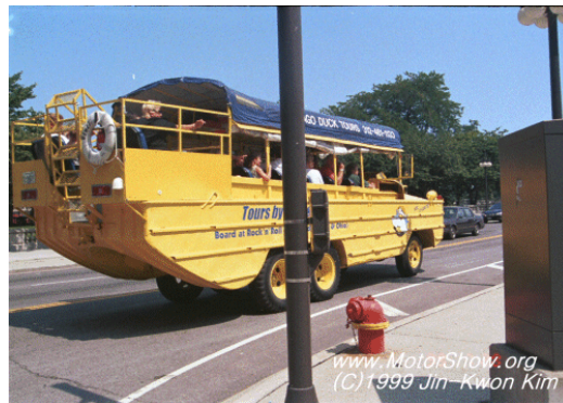
[그림 4-4] 호주의 수륙양용 버스