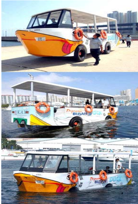
[그림 4-3] 부산의 수륙양용 버스