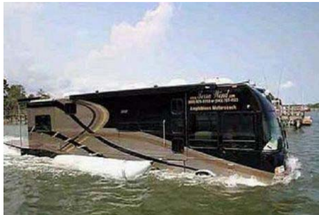
[그림 4-5] 수륙양용 리무진 버스