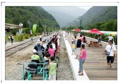
[그림 4-2] 레일바이크 출발역 전경