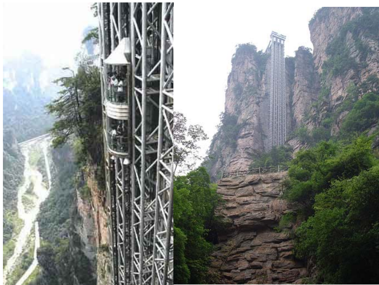
[그림 4-10] 중국 장가계의 절벽 엘리베이터