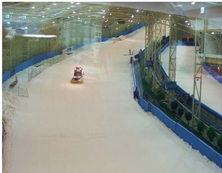
[그림 4-7] 부산 스노우캐슬의 내부전경