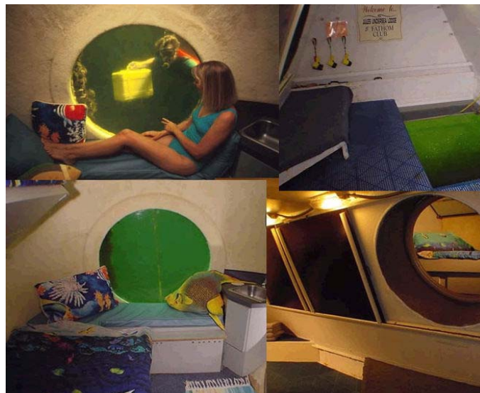
[그림 4-15] 해저호텔의 객실내부