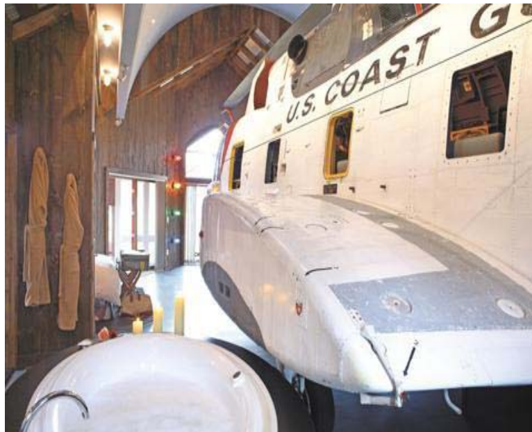
[그림 4-12] 헬리콥터 호텔의 모습