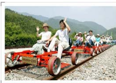
[그림 4-1] 레일바이크 운전모습