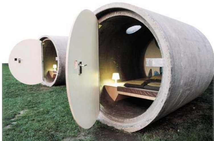
[그림 4-13] 하수도 파이프 객실의 모습