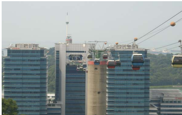
[그림 5-2] 센토사섬 모노레일