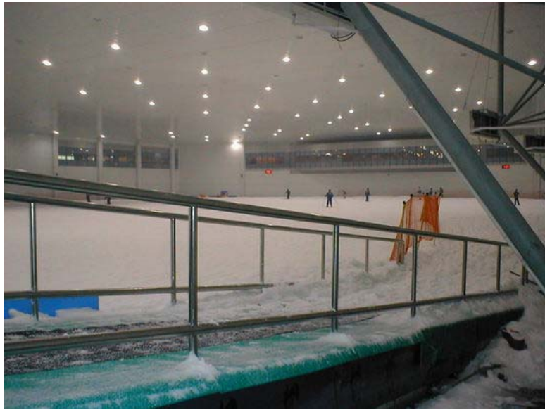
[그림 4-6] 스키돔의 내부전경