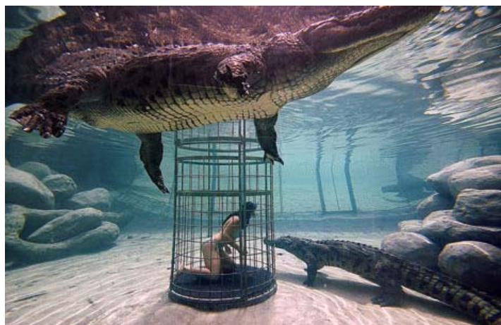
[그림 4-9] 식인악어 체험장면