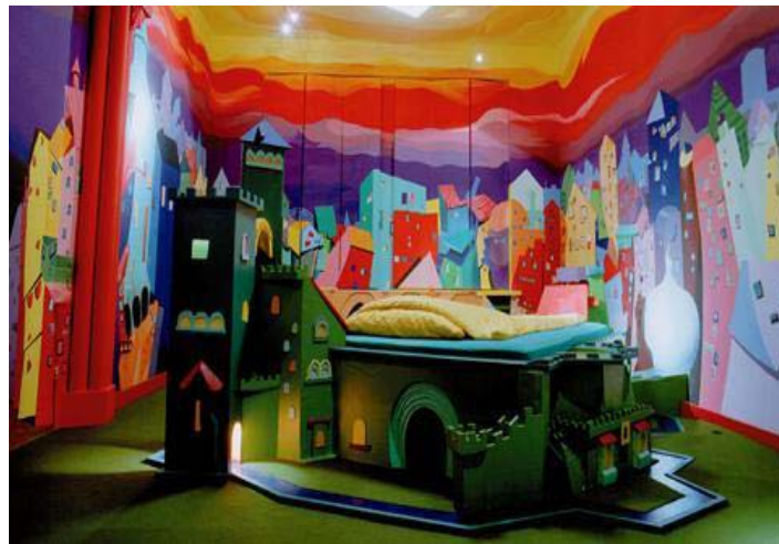
[그림 4-14] 프로펠러 아일랜드 호텔 객실내부