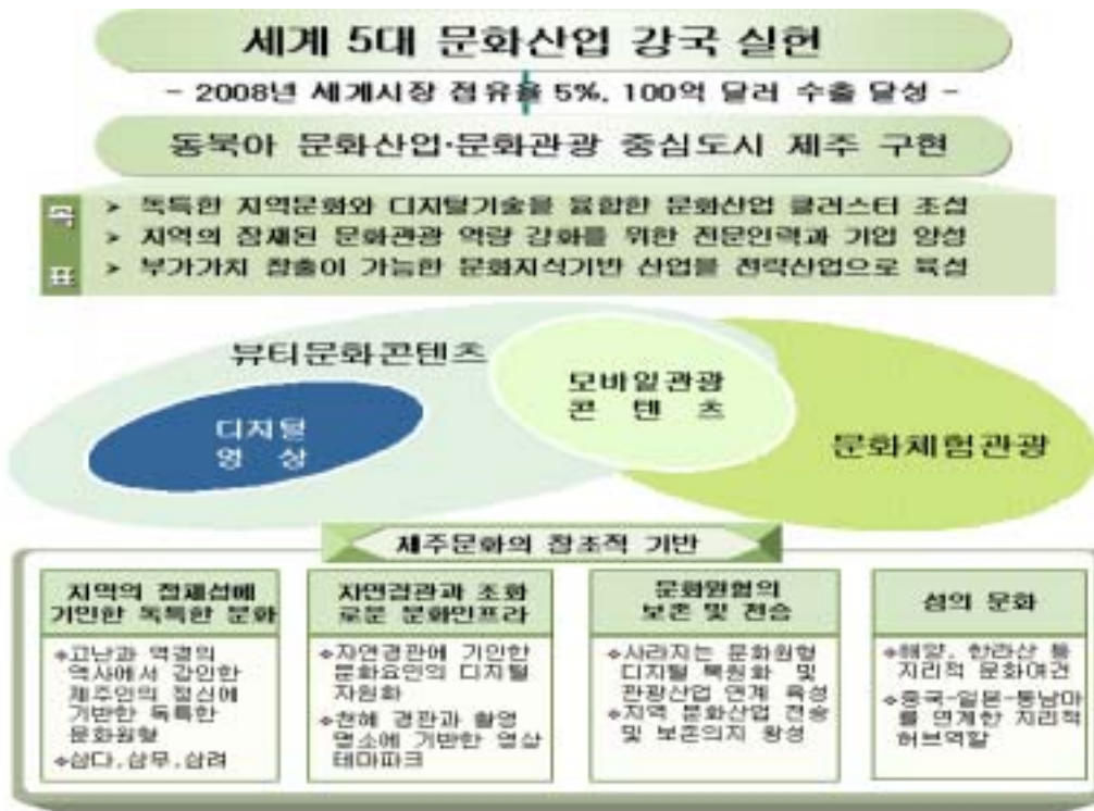
<그림 Ⅱ- 1> 제주뷰티문화콘텐츠 비전

제주뷰티문화콘텐츠 청사진은 지역적 특화와 타지역의 문화클러스터와의 중복성을 피하며, 기존 지역클러스터와의 상생 및 협조적 관계를 유지하는 방향으로의 설정이 필요하며, 이를 요약하면 다음과 같다