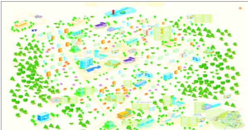
<그림 IV- 1> 클러스터 위치도