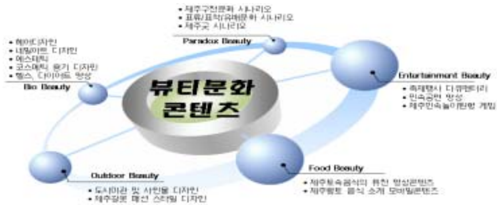
<그림 II- 3> 뷰티문화콘텐츠 영역