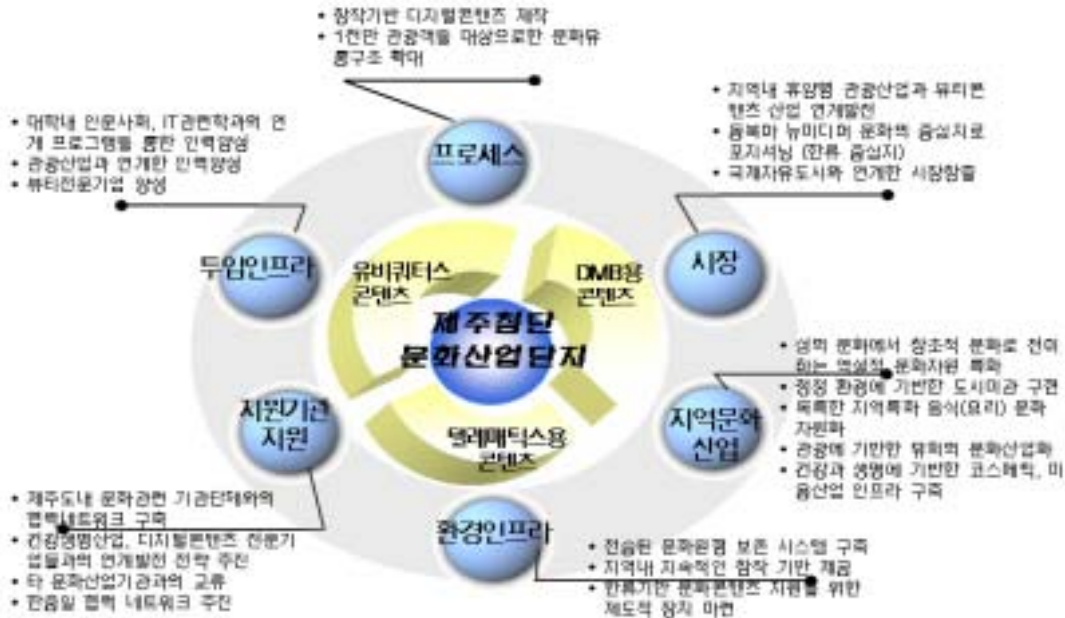
<그림 III- 1> 제주뷰티문화콘텐츠 육성 실행계획

산학연을 중심으로 지역내 공공기관, 금융, 중소기업지원 전문기관 등을 단계별, 프로젝트 지원시스템을 연계한다.