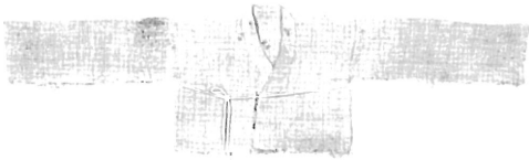
붓뒤창옷 (자료 : 제주국립박물관)

붓뒤창옷이란 배넛저고리를 말하는데 '아기가 아기집에서 나온 다음 입는 큰옷'이라는 뜻이다. 제주에서는 삼베로 만들었으며 옷고름 대신 무명실을 꼬아 달아 무명장수를 염원하였다. 특히 소매는 삼베옷감의 폭을 자르지 않고 그대로 사용하여 만드는데 이 또한 아기가 온전하게 자라기를 염원하는 뜻에서였다. 그리고 건강하게 자란 아기가 입었던 붓뒤창옷은 손이 귀한 집에서 빌려다 입히기도 하였는데 반드시 되돌려 받았다. 이는 이 옷에 깃든 복을 간직하기 위함이며 중요한 시험이나 소송(訴訟)에 나갈 때 지니고 가면 행운이 찾아온다고 하여 부적(符籙)처럼 몸에 지니고 가게 하였다.