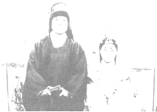
원삼과 족두리 쓴 혼례복

혼례는 해방 후부터 교통수단에 따라서 「신식 결혼」, 「구식결혼」이라는 말이 생겨났다. 구식은 우리 고유의 풍습을 이어 오는 것이고 신식은 양장이 등장하여 신랑이 양복을 입고 신부는 흰 치마 저고리에 머리에는 흰 너울을 쓰는 것을 말한다. 구식 중에서도 새각시의 교통수단, 즉 독교(獨轎)를 이용할 때는 장옷을 입었고 가마를 탈 때는 원삼과 족두리 차림이다. 장옷은 다른 지방에서는 쓰개류였지만 제주에서는 입는 용도로 사