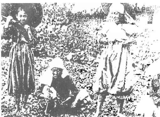
김매기 하는 모습에서 너른바지를 입고 무릎 밑을 끈으로 묶어 활동하기에 편하도록 하였다. (자료 : 제주교육박물관)

노동복으로는 내의로 입던 굴중이에 대님을 매어 입다가 차츰 통이 좁고 바지 단에 겹띠를 달고 허리에는 각각 앞뒤로 끈을 달아 입었다. 일제시대 때 「몸빼」라는 것이 들어오면서 입고 벗기가 편하고 옷감도 적게 들어 실용적으로 받아들여지게 되었다. 갈옷은 이러한 노동복을 감물로 물들인 천으로 만들거나 옷에 감물을 들인 것이다. 갈옷은 제주의 자연환경에 최상의 조건을 구비한 옷이다. 입고 일할 때 몸에 달라붙지 않아서 시원하고 땀이 차지 않으면서도 통풍도 잘 된다. 그리고 땀에 젖은 옷을 그냥 두어도 쉽게 썩거나 상한 냄새가 거의 나지 않는다. 더러움도 덜하고 더러워져도 쉽게 눈에 띄지 않고 또 더러워진 흙먼지도 빨면 때가 잘 빠져서 물이 귀한 제주에서는 안성