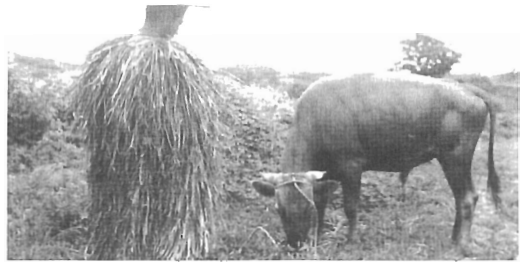
도롱 입은 목자

목자(牧者)라는 용어는 고려시대 이래로 국가의 말(馬)을 돌보던 사람들, 중산간 마을의 목축업자들, 그리고 목축업자의 소와 말을 일정기간 동안 맡아서 돌보던 「테우리」를 포함하는 의미이다. 목자가 한라산 중턱에 방목시킨 마소를 돌보러 갈 때는 추위와 갑작스런 비에도 피할 수 있는 의복이 있어야 했다. 경제적으로 여유가 있는 집에서는 개가죽으로 만든 두루마기와 가죽감퇴, 가죽발레, 가죽버선, 가죽신 등을 신으면 최고였다. 일반 서민들은 도롱이라고 하는 비옷을 입었다. 도롱이의 짜임새가 독특하여 많은 강우량과 불규칙한 방향에서 불어오는 비바람에도 빗물이 스며들지 못한다. 이 도롱이는 비옷 뿐만 아니라 방한용도 되고 산이나 들에서 노숙 할 때는 이불 역할도 하였다. 머리에는 정동벌립이라 부르는 땀망이덩굴로 촘촘하게 결은 모자를 쓰면 빗물도 피하고 가시덤불을 뚫고 다녀도 긁히거나 걸리지 않는다. 중산간 일대에서 얻은 재료를 가지고 그 지역환경에 순응하는 의생활을 만들었던 조상들의 지혜에 절로 감탄하게 된다.