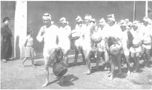
잠수복(물옷, 해녀복)

잠수복은 바닷물 속에서 해산물을 캐내는 작업을 하는 사람의 옷으로 이들이 물질을 할 때 입는 옷을 말한다. 잠수복으로는 물소중이, 물적삼, 물수건, 눈(물안경)을 1970년대까지 입었는데 아마도 최초의 여성전문직업복이라 생각된다. 물옷을 언제부터 입기 시작했는지는 정확한 발생요인이나 시대에 대한 기록이 아직까지 밝혀지지 않고 있다. 다만 1702년의 기록인 『탐라순력도』에 물질하는 사람이 입고 있는 옷이 물소중 같아 보여 이러한 형태의 물옷이 1970년대까지 큰 변화 없이 이어져 오다 이후부터는 고무옷을 입게 되어 오늘에 이르렀을 것으로 보인다. 물소중이는 상체는 몸의 체형에 맞게 하고 하체는 밀 바대가 바이어스로 되어 있어서 신축성이 있고 또 겹으로 되어 있어 견고하여 물 속에서 작업하기 편리하고 신체를 다 드러내지 않고도 입고 벗을 수 있다. 또, 여밈을 단추매듭과 고리로 하기 때문에 신체가 증감되어도 그것에 맞게 조절할 수 있다. 이렇듯이 궁리하여 고안한, 제주인의 특성을 잘 반영한 옷이다.