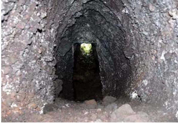
▲갱도내부에서 바깥출구를 바라본 모습.

그 규모는 갱도구축 실태나 마을주민들의 증언을 비춰볼 때 가마오름에서 1개소대 정도의 병력이 이곳에 파견돼 갱도진지를 구축한 것으로 파악된다. 미군의 상륙지점으로 예상되는 송악산 일대 해안가와 수월봉 사이의 저지선을 형성하기 위한 것이다. 즉, 녹남봉은 가마·새신·굽은오름 주저항진지의 전방에 위치한 '전진거점진지' 역할을 했다. 일본군 제111사단의 가장 서쪽에 위치한 전진거점진지인 것이다. 태평양전쟁 말기 제주섬에 주둔한 일본군 배치도인 '제58군배비개건도'를 보면 '전진거점 진지'는 주로 주저항진지의 전방에 위치했다.