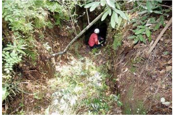
▲ 녹남봉 갱도 앞에 교통호가 길게 이어져 있다.

본보 특별취재팀은 지난 20일 녹남봉에 대한 현장탐사를 통해 60m 이상 되는 관통형 대형갱도 등 10여 곳을 처음으로 확인했다.