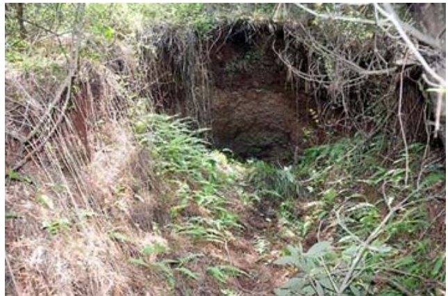
▲녹남봉 정상부에 형성된 갱도 입구와 그 앞쪽에 나있는 장방형 참호.

가마오름은 일본군 최정예부대인 제111사단 예하 243연대본부 주둔지다. 243연대는 가마오름에 연대본부를 두고 새신오름과 굽은오름 일대에 대규모 갱도진지를 구축한 채 탱크 등 중무장 상태로 집중 배치됐다. 녹남봉의 일본군은 3~4개월 정도 주둔했다는 이야기로 미뤄 가마오름과 새신·굽은오름의 갱도구축이 어느정도 끝난 뒤에 이곳에 투입된 것으로 보인다.