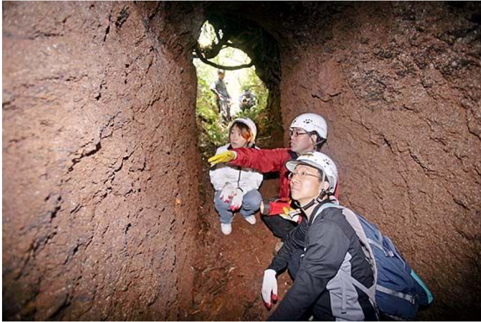
▲ 녹남봉 정상부 분화구 안쪽에 형성된 갱도내부를 취재팀이 살펴보고 있다.