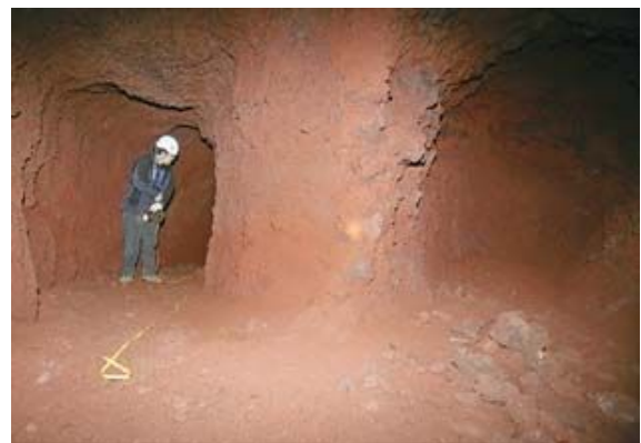
▲특별취재팀이 안덕면 군산에서 확인한 길이

이 곳에는 또 관측구로 보이는 정상부의 갯도와 서로 관통시키려다 중단한 갯도 및 높이와 폭이 1m 내외에 불과한 갯도 등 다양한 구조를 보인다.