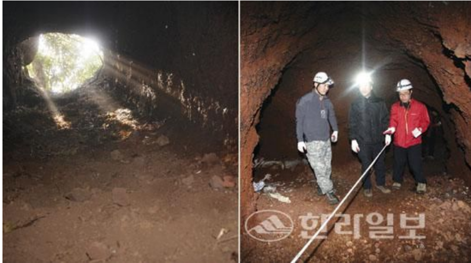
▲특별취재팀이 별도봉 7부 능선 지점에서 찾아낸 갱도(사진 왼쪽). 오른쪽은 갱도 내부를 조사하는 취재팀.