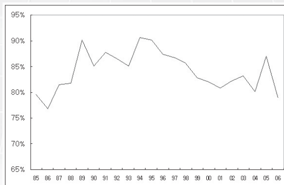
〈그림 2〉 전국평균 대비 제주지역 1인당 GRDP의 추이

한편, 경제발전의 진전에 따라 과밀, 소외 등의 사회문제가 발생하기 때문에 지역복지나 후생수준의 관점에서는 ‘수준’을 나타내는 지표가 사용된다. Klaassen(1981)은 지역의 소득수준과 성장률을 이용하여 동태적 관점의 지역변동경로를 분석하면서 각 지역은 성장지역→정체지역→쇠퇴지역→잠재적 성장지역→성장지역의 순환과정을 거친다는 지역순환가설을 제시한 바 있고, 허문구(2006)는 우리나라의 1인당 GRDP와 그 성장률을 이용하여 지역별로 지역순환가설을 살펴보았다. 제주지역의 경우 수도권 및 대도시 또는 대도시 주변지역이 아닌 지역 가운데 유일하게 1975년부터 1994년까지 성장지역으로 분류되었는데 그 이후에는 정체지역과 쇠퇴지역을 오가는 것으로 분류하고 있다. <그림 2>에서 보여주고 있는 것처럼 전국의 1인당 평균 GRDP에 대한 제주지역 1인당 GRDP의 비율은 1985년 80% 수준에서 증가하는 추세를 보이면서 1994년 91% 수준으로 최고치를 기록한 이후 지속적으로 하락하여 2006년 현재 79%를 기록하고 있다.