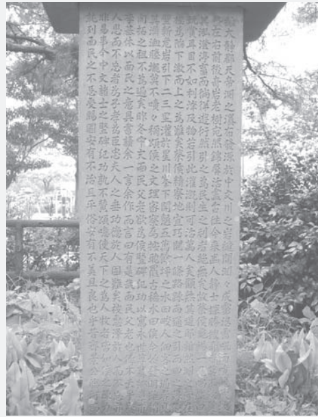
〈그림 2〉 1958년에 천제연 동쪽 언덕에 세워진 채구석기적비 앞면(왼쪽)과 뒷면

를 두른 기암노수는 완연히 금병활화와 같아 예로부터 오늘에 이르기까지 이곳을 탐승하는 사람으로서 그 경치와 또 맑고 깊은 물을 보아 탐미하지 않는 사람이 없다. 그러나 이 물을 당겨서 민생에 이롭게 한 사람은 없었다. 채구석은 이곳을 한번 보고난 후 이곳을 완상하기에만 그치는 것은 너무나 안타까운 일이라고 생각했다. 만약 이것을 灌溉에 이용할 수 있다면 만민을 살릴 수가 있을 것이다. 그 방도가 없겠는가를 궁리했다. 비록 못이 있는 곳이 낭떠러지가 심하여 물을 끌어올리기가 매우 어렵기 했지만 지세를