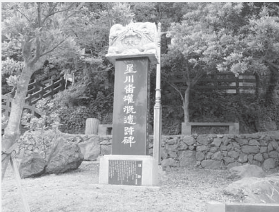
〈그림 3〉 성천담관개유적비 앞면(왼쪽)과 뒷면

먼저 암반위에 장작불을 뜨겁게 지펴 바위를 가열시킨 뒤 다시 독한 소주를 부어 더욱 뜨겁게 가열한 다음 찬물을 부어 급속하게 냉각시켜 폭발하도록 하였다. 암석이 급격한 온도차를 이기지 못해 균열되는 성질을 이용한 것이다.