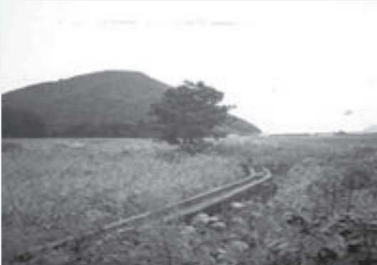
〈그림 1〉 채구석이 수답으로 만들려고 독을 쌓았던 종달리 신숙곶 일대의 갈대밭.