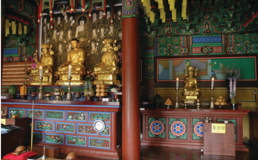
〈사진 3〉 관음사 대웅전 삼존불 우측에 모셔진 관음보살

리에 쓰고 있는 관) 중앙 정수리에 자그마하게 아미타부처님이 앉아 계신 모습을 살펴보면 된다. 이러한 관세음보살을 모신 전각을 관음전(觀音殿) 또는 원통전(圓通殿)이라고 한다.