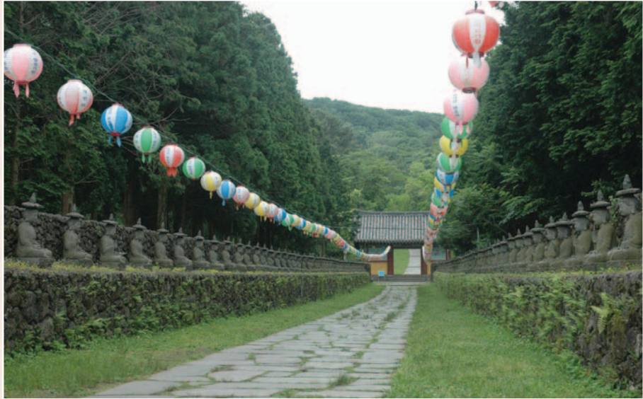
〈사진 1〉 관음사 입구

그렇다면 관음사 목조 관세음보살좌상의 매력이 무엇이며 어떤 것인지 살펴보자.