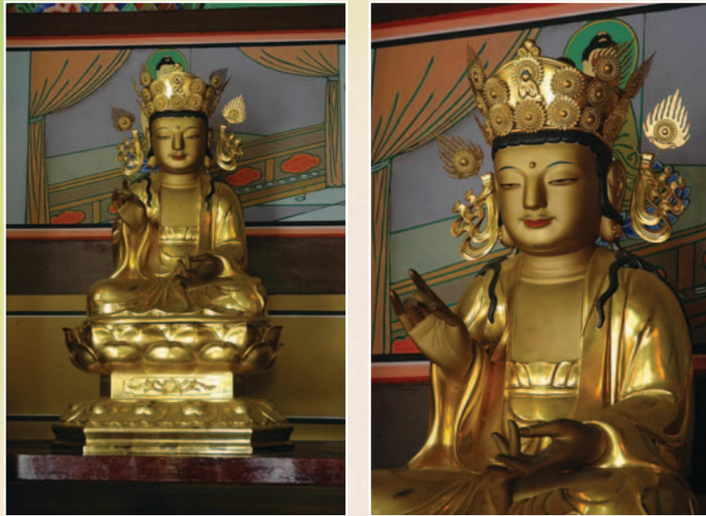
〈사진 2〉 관세음보살좌상

이상은 관세음보살상에 대한 미학적 설명이라고 할 수 있다. 그렇지만 문화에 대한 해석이 여기서 그친다면 뭔가 부족한 느낌이 있다. 그래서 당연히 이 관세음보살상이 오늘날 우리에게 주는 의미를 되묻지 않을 수 없다.