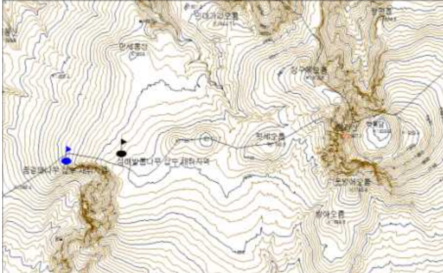
그림 1. 쯔갈매나무 및 섬매밭뜯나무의 삼수채취 위치도

며, 섬매밭뜯나무는 4월 8일에 잎눈이 과열하여 5월 4일에 개엽하였다.