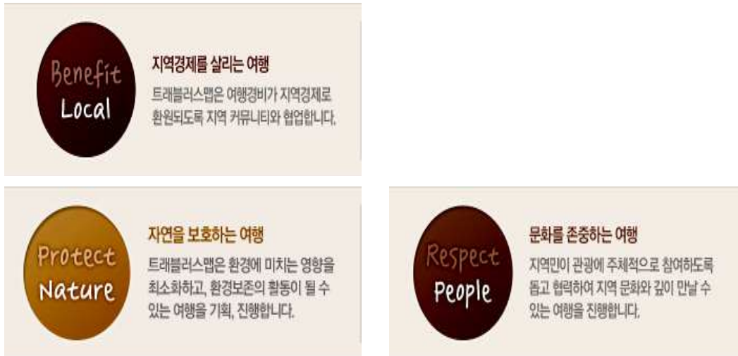
[그림 3-2] 트래블러스맵의 여행개발 원칙

여행자들에게 제시한다, ⑤각각의 여행에서 벌어질 수 있는 인권 및 동물권 보호를 위한 구체적인 지침을 제시한다 등의 5가지 세부 원칙이 있음.