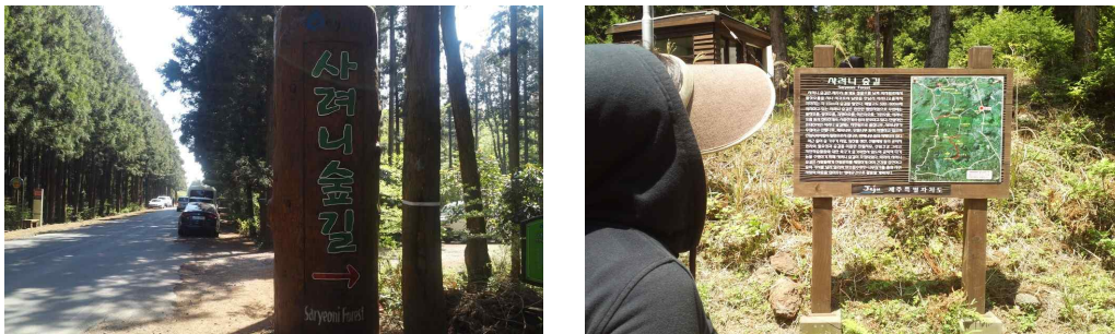
[그림 5-2] J-공정환경여행 이미지