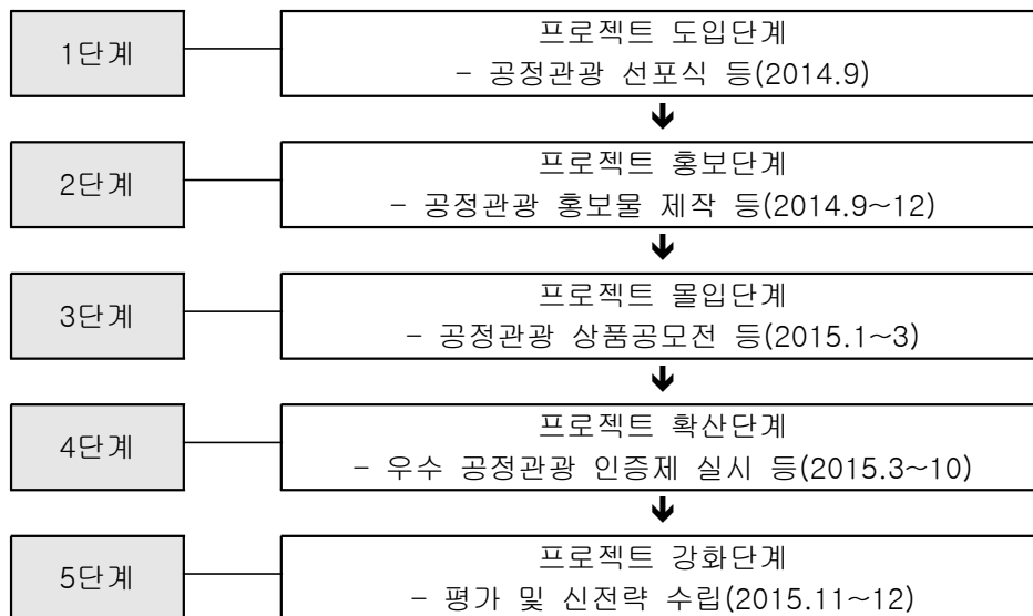
[그림] 공정관광 프로젝트 단계별 전략