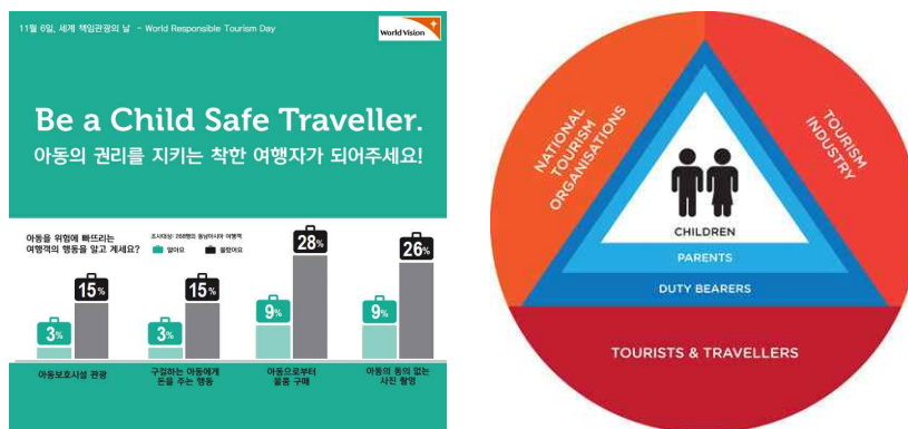
[그림 3-4] 월드비전 차일드후드 프로젝트