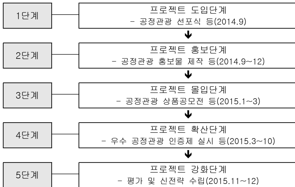
[그림 5-1] 공정관광 프로젝트 단계별 전략