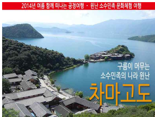
[그림 3-1] 국제민주연대의 주요 공정여행