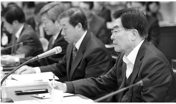
제주도는 28일 우근민(맨 오른쪽) 지사와 도본청, 행정시 간부공무원, 읍면동장, 유관기관 관계자 등이 참석한 가운데 도정 중점과제 추진보고회를 열었다.

한편 고교 취약계층 학생까지 합쳐 이번 무상급식 수혜자는 전체 학생의 81%인 7만4670여명으로 집계. 전진희기자