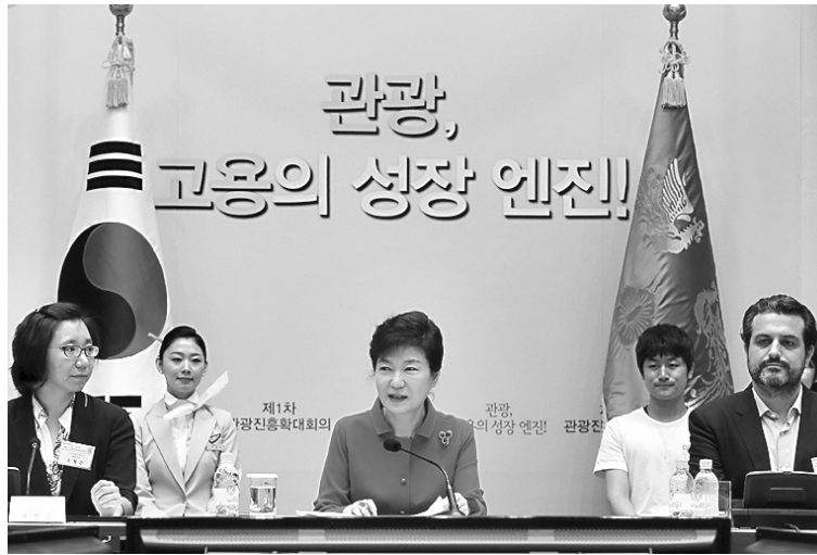
박근혜 대통령이 17일 오전 청와대 영빈관에서 열린 제1차 관광진흥확대회의에서 관광산업의 활성화 방안 등에 대해 말하고 있다.

이와함께 권역별로 크루즈 관광 특화전략을 마련하고 항만 배후단지에 주거·업무·숙박·문화 등의 인프라를 구축해 관광 체류여건을 조성할 방침이다.