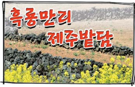
10. 제주미학의 정수

제주밭담의 바람결을 따른 곡선, 현무암의 검은 색 등은 제주섬의 선과 색을 대표하는 제주 미학의 정수로 평가받는다.