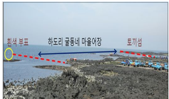
자료: 저자 촬영, 2015.5.2.