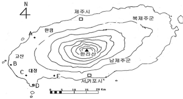
Fig. 1. The site of the scoria samples taken from western seaside area of Jeju.

채취하였으며 채취 위치는 분화구 정상 주변으로, 각 지역은 Fig. 1에 나타내었다. 채취된 시료는 공기 중에서 충분히 건조시켜 60 \mu\text{m} 이하가 되도록 분말로 분쇄한 후, X-선 회절 분석 및 X-선 형광분석용 시료로 이용하였고, Mössbauer 흡수체로 사용하기 위한 분말시료는 시료의 양이 10 mg/cm 2 가 되도록 정밀하게 측정 후, 유압기로 5000 psi의 압력을 가하여 직경 21 mm, 두께 1 mm의 원판모양으로 만들고 Al foil로 양면을 봉하여 사용하였다. X-선 형광 실험을 위해 시료의 함량 0.6 g과 용제(Li 2 B 4 O 7 , lithium tetraborate) 6 g을 혼합하였고 40 kV, 30 mA 조건에서 측정하였다. X-선 회절을 위한 측정 파장은 1.5425 Å인 CuK \alpha 선을 이용하였고 2 \theta 의 범위는 5~50°, 전류는 20 mA, 가속 전압은 30 kV 그리고 주사 속도는 10°/분으로 하였다. Mössbauer 분광 실험을 위해 Dupont사의 10 mCi Co 57 단일 \gamma 선원을 사용하였고 흡수체와 검출기 사이의 거리는 120 mm로 유지하였으며 24시간 이상 공명흡수선을 측정하였다. 이 때 측정계수가 약 4 \times 10 5 ~5 \times 10 6 가 되도록 하였으며 Doppler 속도는 \pm 12 mm/s가 되도록 조절하였다.