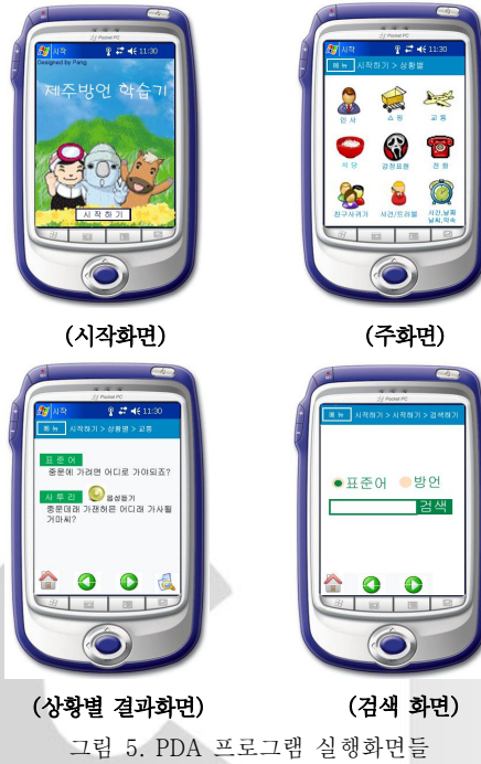
그림 5. PDA 프로그램 실행화면들

다음 [그림 5]는 시작화면과 메인 메뉴 화면 및 상황별로 방언을 검색해보는 화면과 검색하는 화면을 나타낸다.