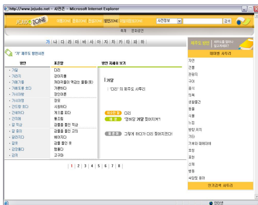
그림 3. 제주도닷넷의 제주방언 페이지

제주도 닷넷이란 제주도 지역 검색 포털 사이트에서도 ‘방언ZONE’이라는 제주도 방언사전이 설치되어 있다[9][그림 3].