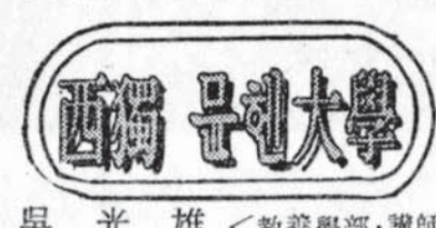
吳光雄 <敎養學部 講師>

본문: 세계속의 大學: 大學生들... (Main article text about university students worldwide)