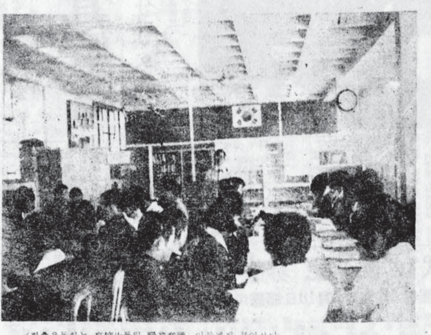
이것은 어떤 직업교육의 장면을 보여주고 있다.