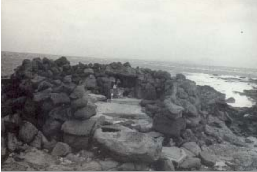
<사진 4> 마라도의 할망당

자료 : 김영돈(1993), 제주민의 삶과 문화, 도서출판 제주문화, 화보