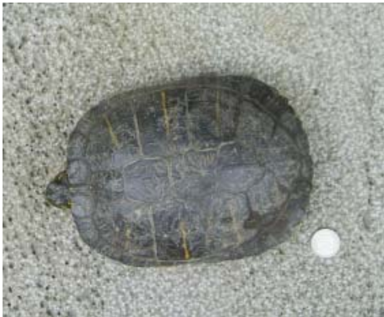
Figure 3. A sample of Trachemys scripta elegans captured in downstream of Cheonji pond. The total length of this adult was 19.95cm.

15) 서귀포시 천지연과 연외천 (N 33° 14′ 39″, E 126° 33′ 36″) 천연기념물로 지정된 난대림 지역으로서 흰뺨검둥오리와 잉어 Cyprinus carpio 가 많이 서식하고 있다. 천지연에서는 2개체, 매표소 부근과 중간지점에서 4개체 그리고 연외천에서 13개체 총 19개체가 관찰되었다.