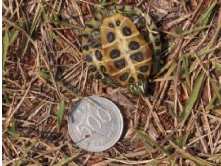
Figure 2. A sample of Trachemys scripta elegans captured in Mungang temple. The total length of this hatchling was 3.97cm.

12) 북제주군 조천읍 신촌리 남생이못 (N 33° 31′ 47.6″, E 126° 36′ 58.6″)