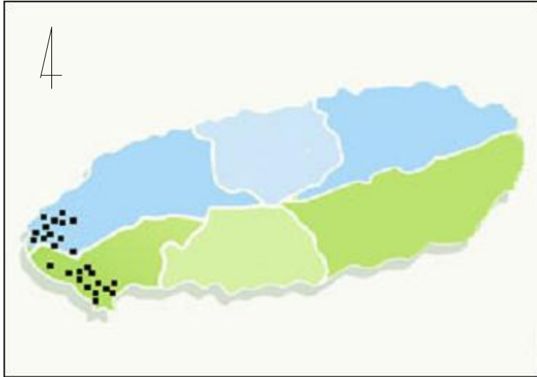
Figure 1. Distribution of Rana catesbeiana in Jeju Island. Habitats of Rana catesbeiana were found only in Hangyeong-Myeon, Daejeong-Eup and Sagye-Ri, Andeok-Myeon. So we make a decision that they are only living a part of west Jeju Island up to now.