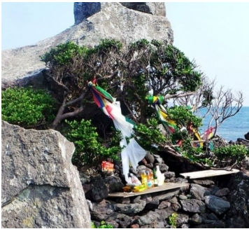
(그림 3) 제주시 구좌읍 종달리의 신당(神堂), <생개납 돈짓당>

하나의 거대한 화산암으로 이루어진 제주의 자연은 여타 지역과 다른 특색을 지니고 있으며, 이는 사회문화에 큰 영향을 끼쳐 왔다. 특히, 화산지대로서 돌이 많은 풍토적 특성은 제주의 물질문화에 특정 양식을 형성하는 중요한 요소이다. 토지는 조금만 파고들어가도 화산활동으로 형성된 암반이 절리층(節理層)이 이루고 있으며, 지표는 화산회토(火山灰土)로서 돌이 많아 제주의 돌 문화의 형성에 큰 배경이 되었다.