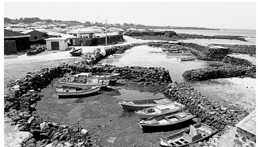
(그림 5) 제주시 애월읍 고내리의 옛 포구

그러나 제주인에게 ‘돌’이라는 존재는 항상 친숙하고 유익한 대상인 것만은 아니다. 제주도를 구성하는 암석의 90% 이상은 검은빛의 다공질(多孔