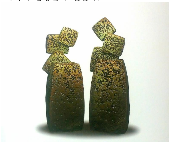
(그림 8) 허민자, <Two People>, 석기점토, 1996

허민자 작가는 제주의 자연과 화산암의 조형적 특성 및 이미지를 재해석하여 다양한 돌의 형상과 질감에서 비롯된 느낌을 기조(基調)로 그 안에 작가의 심상을 표현한다.