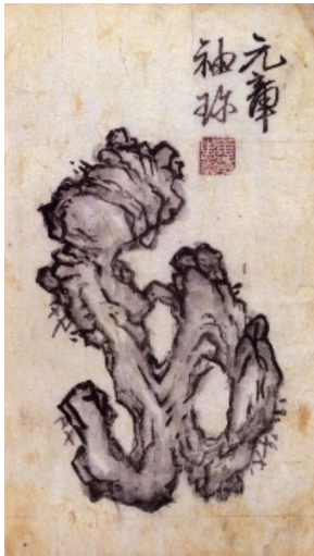
(그림 1) 강세황 <괴석도>, 1712 지본수묵(紙本水墨)

그 오묘함과 경이로움을 담은 <괴석도(怪石圖)>는 문인화(文人畫)의 한 화제(畫題)로, 한국에서는 조선 후기에 본격적으로 그려진 기이한 바위를 그린 그림이다.(그림1)