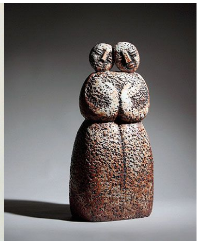
(그림 9) 허민자, <기쁨으로 찬미하세>, 조합토, 2009