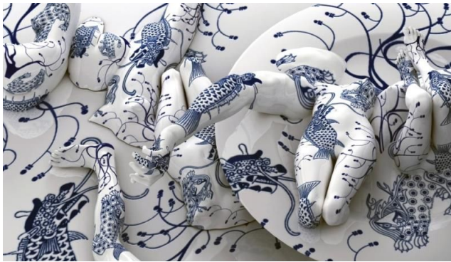
(그림 10) 김준, <fragile-dragon> , digital print , 2010

인체를 해체하거나 변형하고, 도자기라는 물성과 개념을 이용함으로써 연구자와 유사한 소재와 표현을 가지는 김준 26) 작가의 작품 연구를 통해 본 작업에서 인체라는 소재가 가지는 표현의 차이와 내용은 무엇인지 분석하고, 연구자의 인체 표현형식을 서술한다.