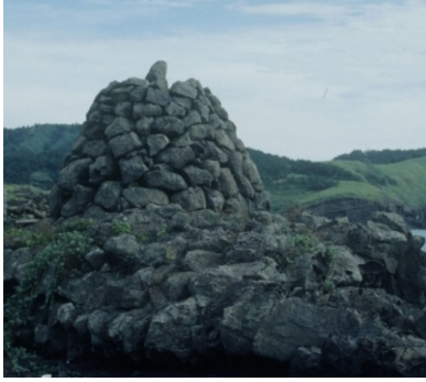
(그림 6) 용수리 방사탑

제주도 곳곳에 산재해 있는 ‘돌하루방’ 17) 과 ‘방사탑’ 18) , 그리고 조상의 묘를 지키기 위한 ‘산담’ 19) 과 ‘동자석’ 20) 에서 제주 사람들의 삶과 현실을 대치하는 또 다른 일면을 볼 수 있다. 21) (그림 6, 7)