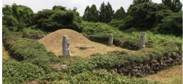
(그림 7) 산담과 동자석