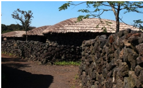
(그림 4) 제주의 초가(草家)와 돌담

“돌로 바람을 막고 돌을 쌓아 집을 만들고 생활도구와 놀이기구를 만든다. 포구(浦口)를 만들어 파도를 막고, 신당(神堂)을 만들어 의례(儀禮)를 행한다. 돌은 신상(神像)도 되고 경계표도 되고 집도 되며 길도 된다” 12) 라고 제주 사람들의 삶을 설명하는 데 ‘돌’이 빠지지 않을 만큼, 생활 곳곳에서 삶과 떼어 수 없는 도구 이상의 무엇으로 존재해 왔다. (그림 3,4,5)