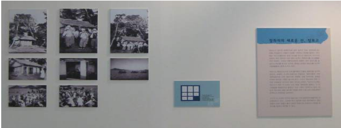
이두현 교수 기증 사진자료 광주시립민속박물관 특별전시 지원