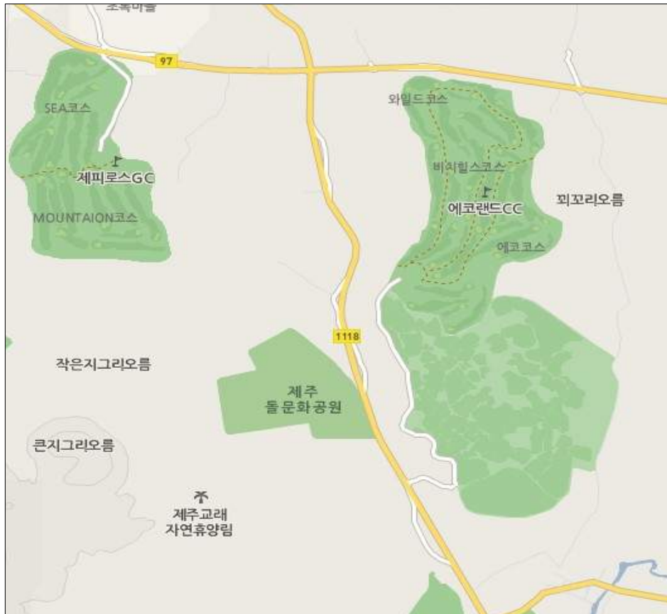
[그림 1] 사업대상지의 위치 및 접근체계