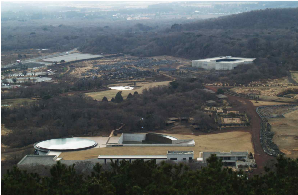
[그림 2] 바농오름에서 바라본 돌문화공원 전경