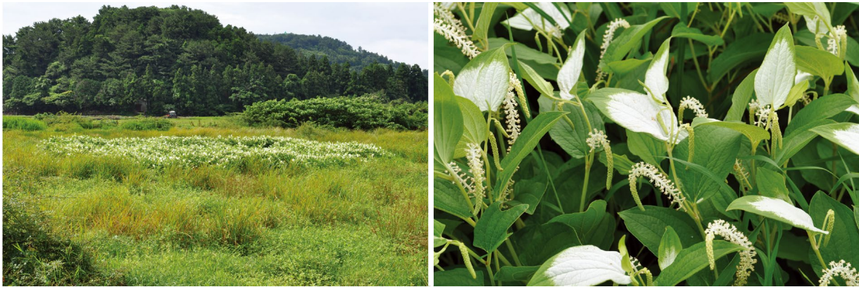
Fig. 3. Saururus chinensis (Lour.) Baill. in Hanon paddy fields.

에서만 생육하는 고유식물이기 때문에 소중한 식물자원이지만, 본 조사에서는 확인되지 않았다. 국립수목원이 제정한 희귀식물에는 물질경이 ( Ottelia alismoides (L.) Pers.), 창포 ( Acorus calamus L.), 물잔디 ( Pseudoraphis ukishiba Ohwi) 등 3과 3속 3종이 확인되었다. 약관심종 (Near Threatened; NT)에 속하는 물질경이는 모든 농수로에 출현하였지만 특히 하논 중앙에 동서로 연결되어 있는 물의 흐름이 느린 수로에서 많은 개체들이 확인되었다. 창포는 약관심종으로 하논 I구획의 휴경논에 군락을 형성하고 있었다. 취약종 (Vulnerable, VU)에 속하는 물잔디는 경작하는 논 논둑에서 소수 확인되었다. 하논의 선행연구에서는 이러한 희귀식물들이 없는 것으로 보고하였다 (Lee et al. 2005). 현재 제초제 사용 등 관행적으로 이루어지고 있는 벼농사가 친환경적으로 수행된다면 보다 풍부한 식물이 하논에 정착할 수 있을 것으로 생각한다.