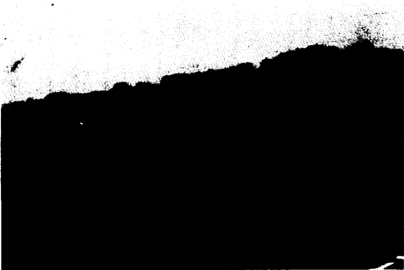
◇ 구좌읍 하도리 철새도래지.