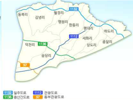
그림 2 월정리 위치