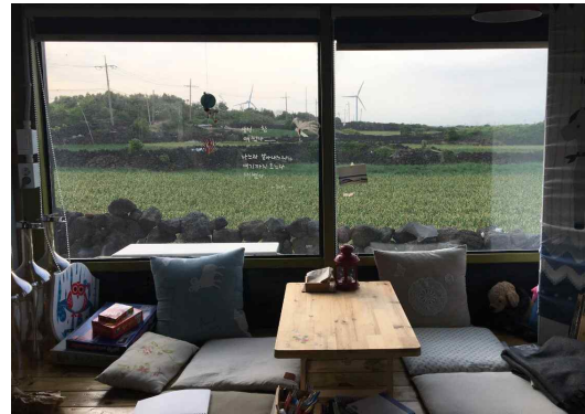
그림 10 월정리 카페 내부에서 바라 본 마늘 밭

공간에 대한 미학적 감각은 특정 장소와 ‘거리’를 동반할 때 생겨난다. 어촌마을에서 바다는 ‘바라보는’ 대상이라기보다는 해산물을 채취하고 생계를 꾸려가는 공간으로 이용된다. 하지만 관광객의 시선은 다르다. 해안경관이 일상에서 벗어난 낭만적 ‘아름다움’으로 표상된다. 전형적인 촌락의 노동공간인 밭 역시도 경관이 된다. 신자유주의적 프랜차이즈 커피숍이 자연과 완전히 차단된 채로 도시적 공간을 판매하는 것과 달리, 제주의 카페들은 자연과 하나가 되는 환상을 소비자에게 판매하는 것으로 보인다. 제주 곳곳에 여행객을 대상으로 하는 카페들은 큰 창을 통해 풍경을 액자화하고 판매의 대상으로 삼는다. 이러한 이미지 소비의 아이러니는 많은 사람들이 실제로는 커피와 풍경에 비용을 지불하고 있으면서도 마치 물질적 삶과는 유리된 낭만적 일상을 실현하는 것처럼 생각한다는 것이다. 그들은 바다가 보이는 카페에서 풍경을 감상하며 자유나 해방감 같은 느낌을 소비한다.