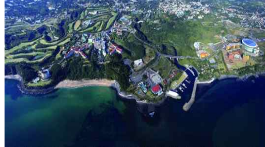
그림 4 중문관광단지 개발 이후