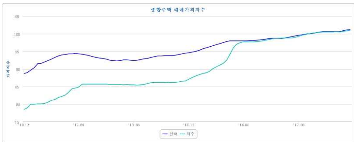
그림 7 전국 및 제주 주택매매가격 지수

이주자들은 농촌마을에서 플리마켓, 농가공연 등을 통해 제주의 이미지를 부각시키는 다양한 이벤트를 개최하며, 제주지역의 이미지 구성에 커다란 영향을 끼치게 된다(부혜진, 2018:23). 한편 농촌생활의 소박함을 근사하게 연출하는 텔레비전 프로그램을 비롯한 대중매체의 역할도 무시할 수 없다. SNS를 통해 널리 퍼진 유명연예인들의 제주살이 역시 목가적 생활에 대한 비전을 유행처럼 퍼지게 만들었다. 필립스(Phillips, 2000) 역시 촌락 젠트리피케이션의 중요한 특징 중 하나로 광고와 라이프스타일 등을 포함하는 대중매체 담론이 촌락 경관의 상징적 창조를 야기한다고 말했다. 여기에서 타자는 전형적인 이미지로 재현되기 때문인데, 특히 이 과정에서 작은 마을들은 집요하게 위험한 도시환경으로부터 안전한 현실도피의 장소로서 판매된다(Donaldson, 2018:140). 최근에는 도시에서는 경험할 수 없는 ‘소박한’ 제주의 일상 그 자체를 향유하고자 하는 이러한 시도들이 경쟁적으로 번져나가 ‘제주에서 한 달 살기’ 같은 독특한 형태의 수요도 생겨나고 있다.