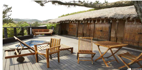
그림 6 성천포 마을 가옥을 리모델링한 리조트

바다를 품은”이라는 수사를 동원하여 제주의 고유성이 담긴 장소이미지를 부각시키고 있다.