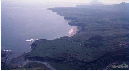
그림 3 중문관광단지 개발 이전