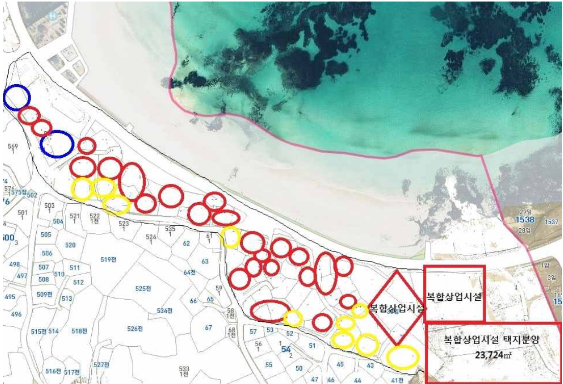
그림 12 2010년 이후 월정리 해안가 주택 및 상업시설 현황 (2018. 7. 31. 기준)