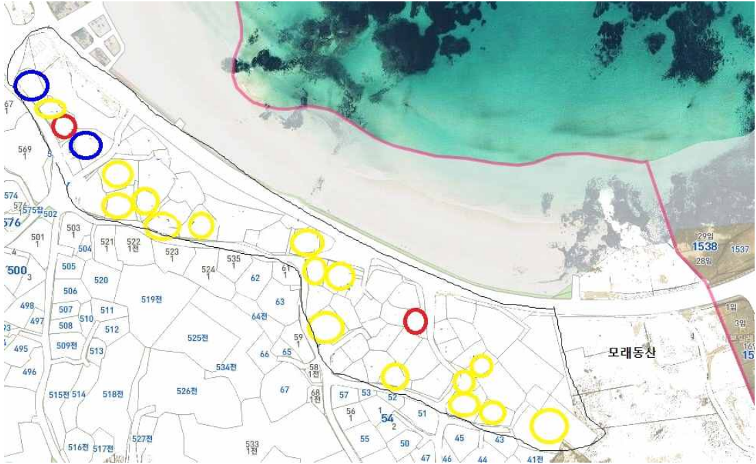
그림 11 2010년 이전 월정리 해안가 주택 및 상업시설 현황 (2009. 12. 31. 기준)