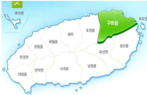
그림 1 구좌읍 위치