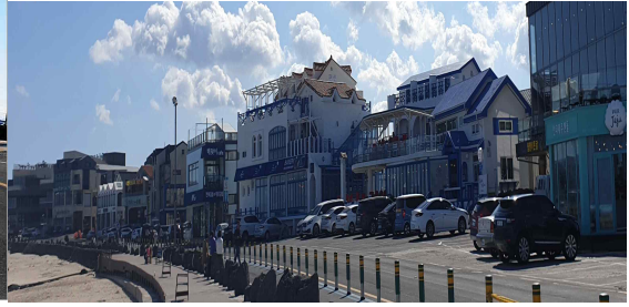
그림 14 2018년 월정리 해안가 (출처: 직접촬영)

새롭게 구성된 해안경관 이미지의 인기가 치솟자, 월정리 해안에는 기다렸다는 듯이 카페와 펜션이 들어섰다. 주민들의 삶의 터전이었던 주택들이 속속들이 카페와 펜션으로 변모하기 시작한다. 2010년과 2018년의 해안가 풍경은 마치 같은 장소라 할 수 없을 정도로 상반된 모습을 보인다. 2010년 촬영된 <그림 13>에는 카페 하나가 덩그러니 있는 반면, 2018년 촬영된 <그림 14>에는 비슷한 카페와 펜션이 해안가를 빼곡히 채우고 있다. 이렇게 형성된 ‘카페거리’는 제주관광공사의 팸플릿의 한 페이지를 차지하면서, 관광객이라면 꼭 가봐야 할 명소가 되었다.