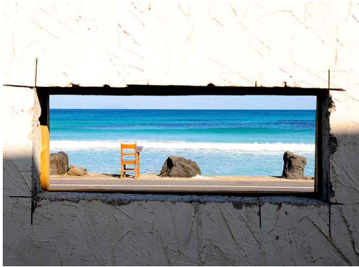
그림 9 월정리 카페 내부에서 바라 본 해안