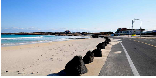
그림 13 2010년 월정리 해안가