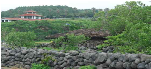
그림 5 성천포 마을