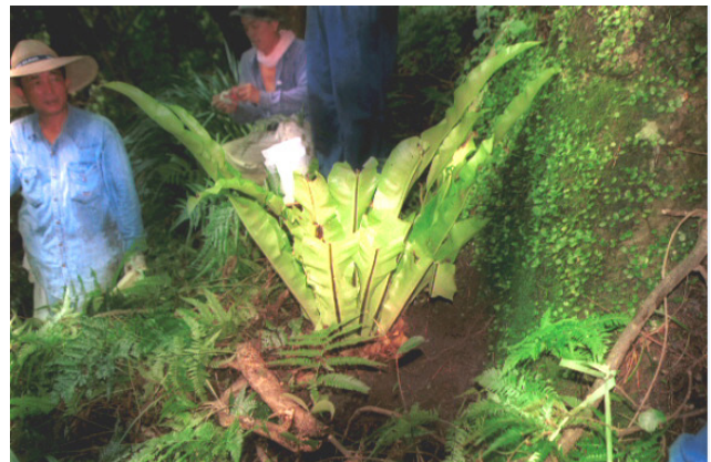
A. antiquum of 25 years old was transplanted in 2000(cultural properties repair report, 2000).