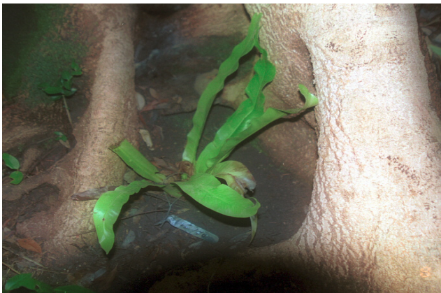
A. antiquum of 5 years old was transplanted in 2000(cultural properties repair report, 2000).