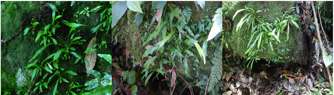
Figure 3. The seedling pictures of A. antiquum from left to right(monitoring site 1, site 2, site 3).

한편 기 설치된 문화재안내판은 오래되고 가독성이 떨어지므로 보수가 필요하며, 섬에 직접 오지 않으면 안내판 확인이 어려운 상황이다. 따라서 인근의 보목포구나 서귀포항 등지에 파초일엽 자생지에 대한 정보제공과 이용 안내를 위한 문화재안내판의 추가설치가 필요하다. 이번 연구가 천연기념물 파초일엽 자생지의 체계적인 관리를 위한 기초자료로써 유의미하게 활용될 수 있을 것으로 기대된다.