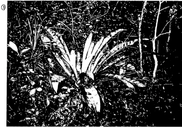
A. antiquum was discovered at the time of joint investigation by the Ministry of Environment (1996).