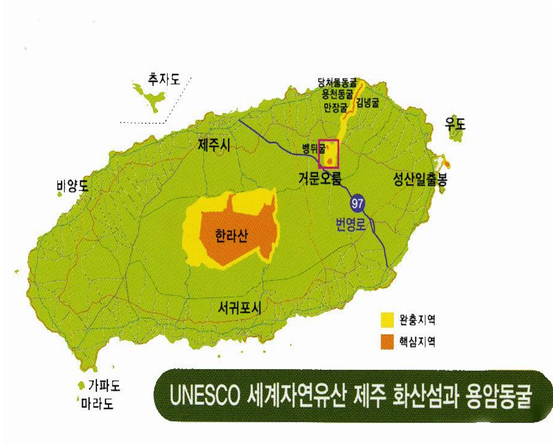
<그림 1. 세계자연유산 ‘거문오름 국제트레킹’ 개최 장소>