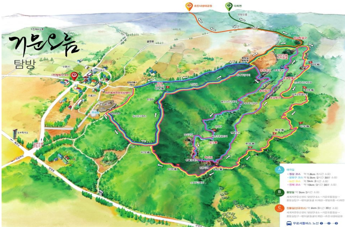
<그림 3. 거문오름 코스도>

탐방안내소 -> 거문오름 정상 -> 용암길 입구 -> 벵뒤굴 입구 -> 흐린내생태공원 ※ 코스 중 ‘벵뒤굴’ 동굴 자체는 미 개방