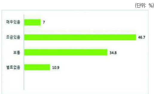
〈그림 3〉 일·가정양립 어려움 정도