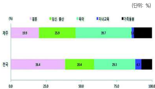
〈그림 1〉 기혼여성의 경력단절 사유