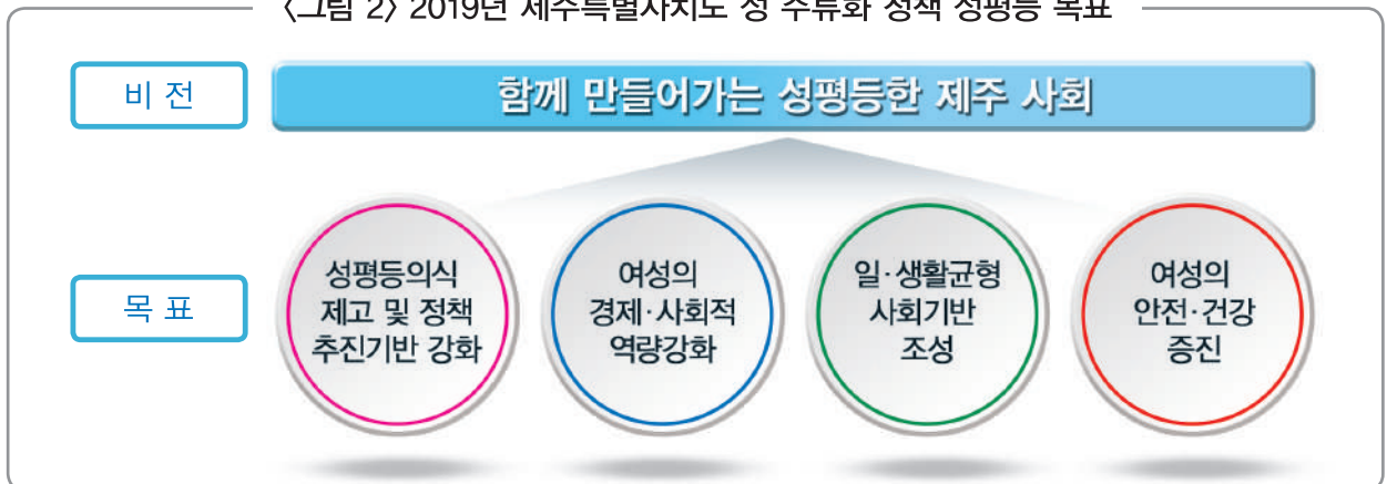
〈그림 2〉 2019년 제주특별자치도 성 주류화 정책 성평등 목표