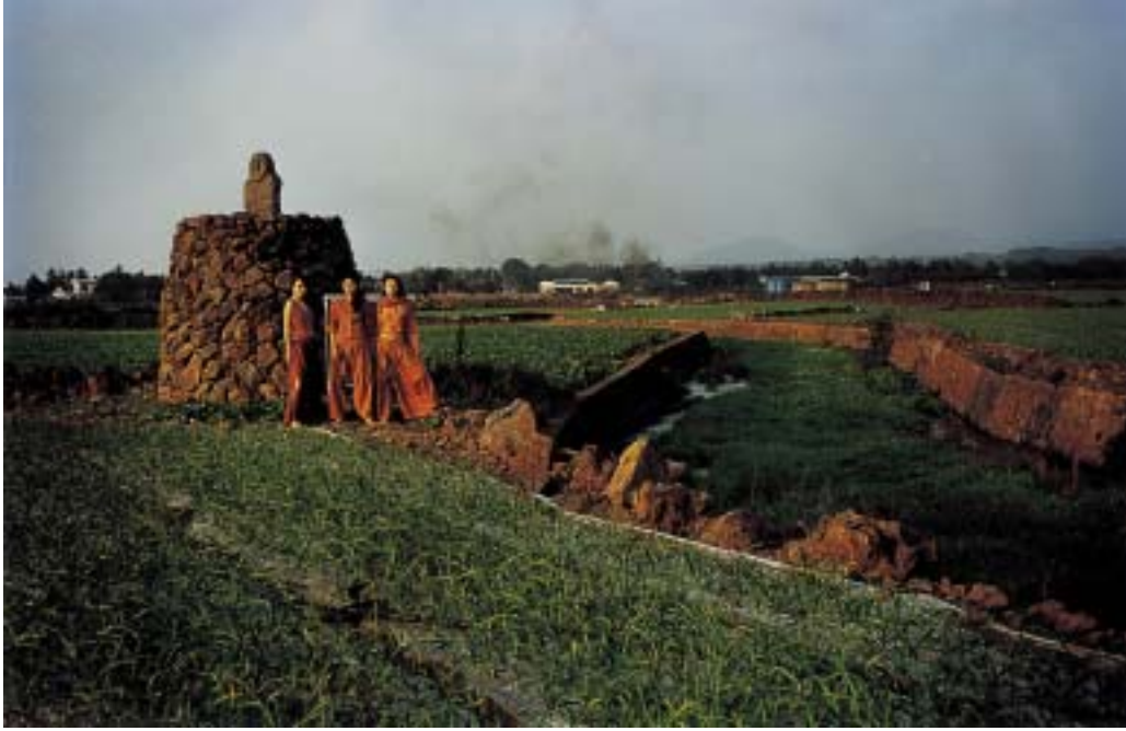
작품 13 - 방사탑