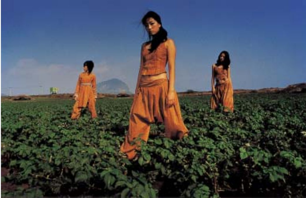
작품 1 - 알뜨르 비행장