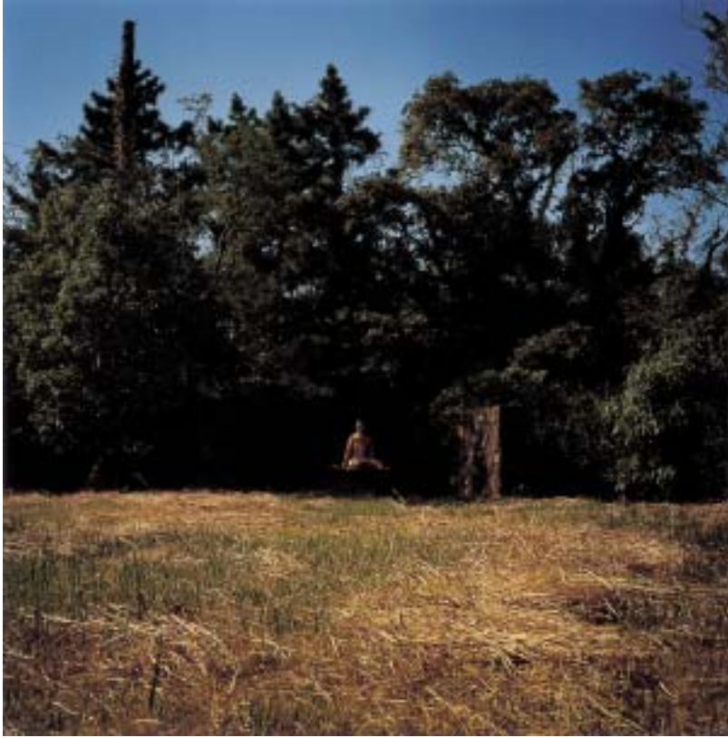
작품 9 - 당