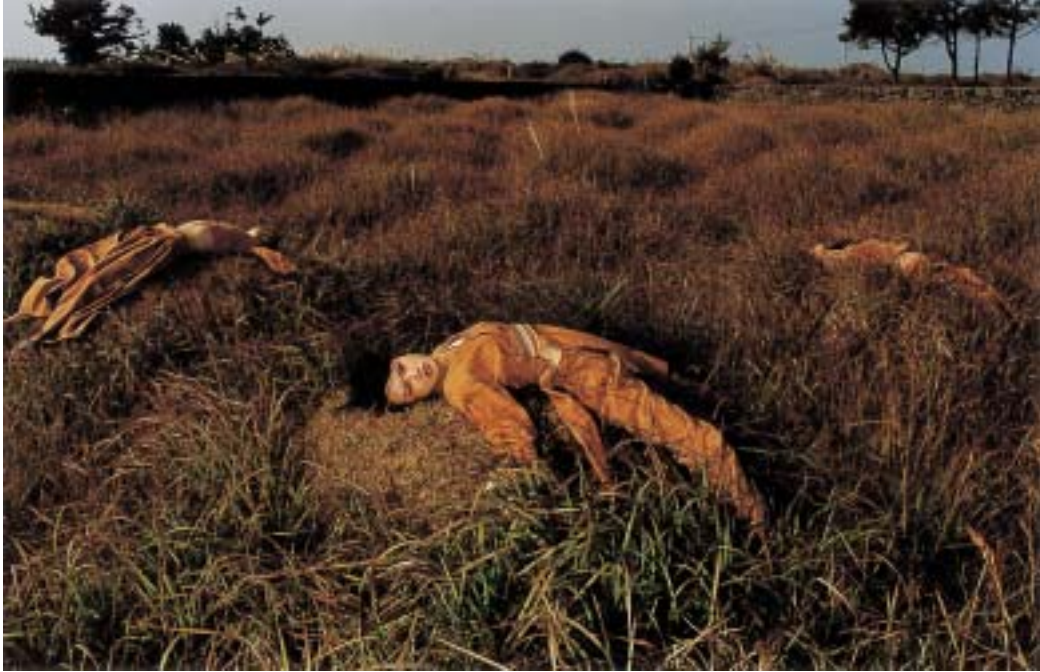
작품 6 - 백조일손지지묘