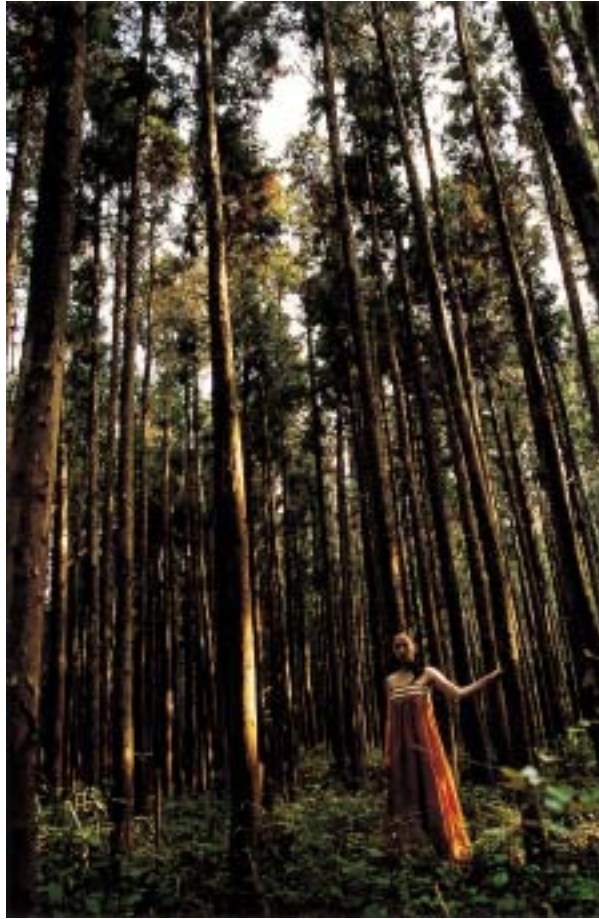
작품 15 - 숲