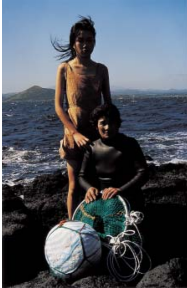
작품 12 - 어머니와 딸