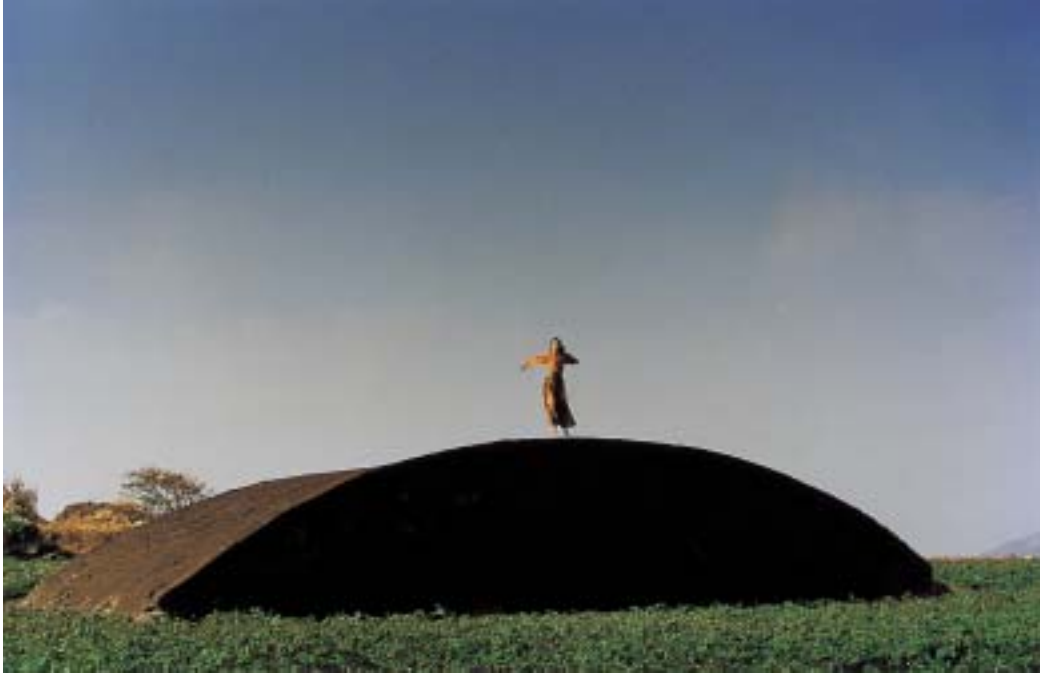
작품 10 - 격납고