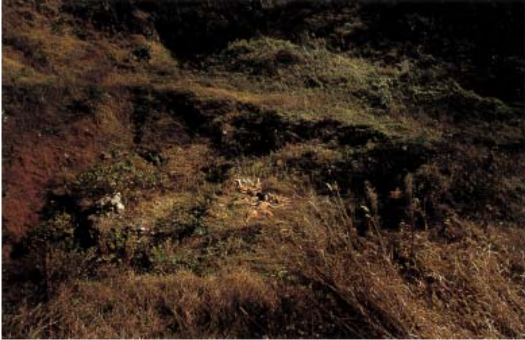
작품 4 - 4.3 학살터