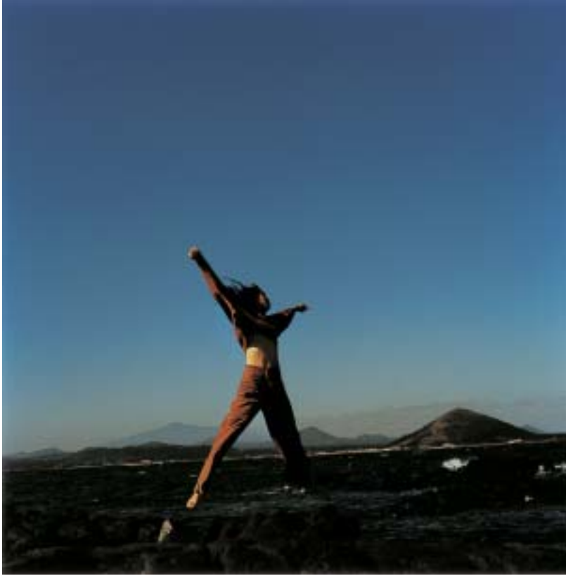
작품 2 - 바다