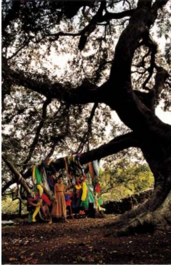
작품 8 - 서낭당