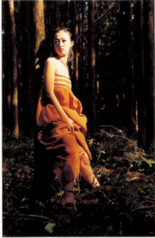
작품 14 - 숲