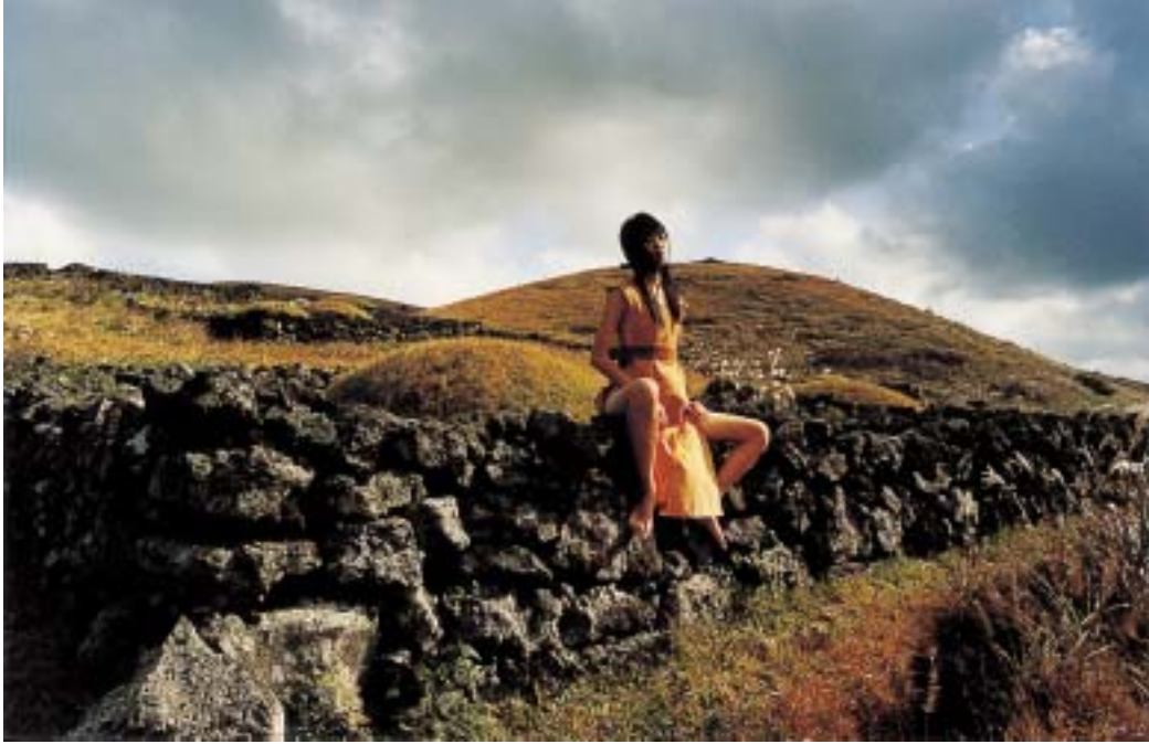
작품 7 - 산담