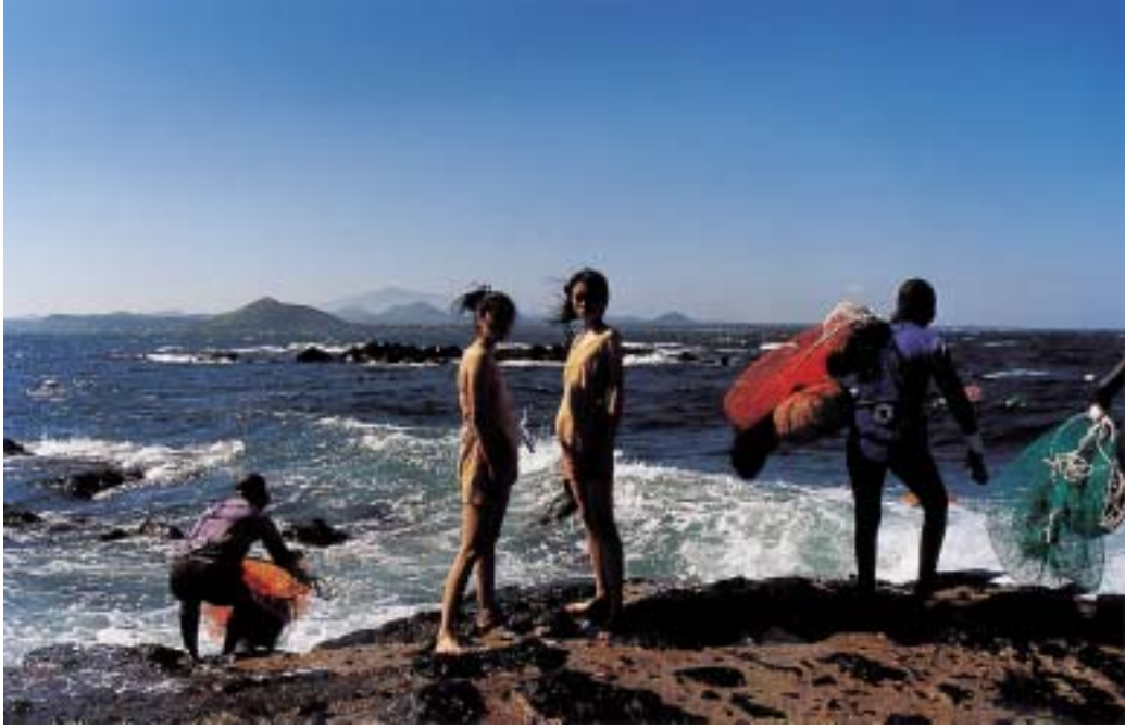
작품 11 - 해녀들