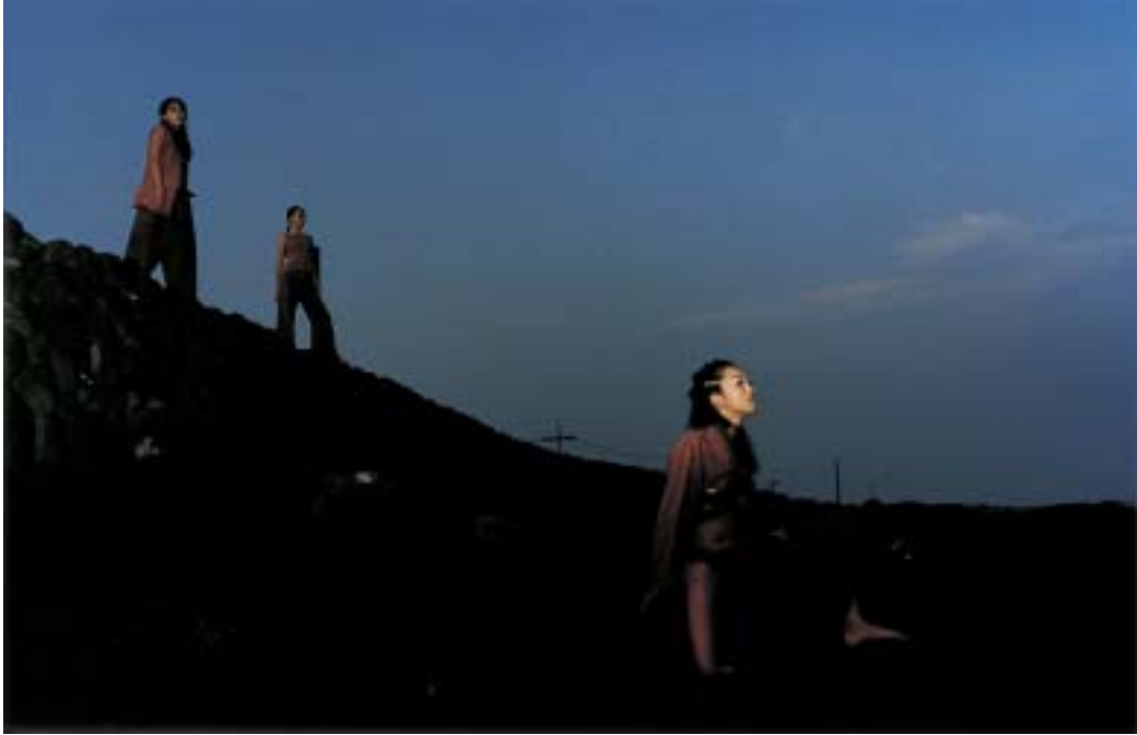
작품 5 - 환해장성