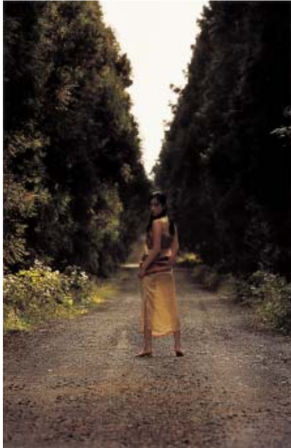
작품 16 - 길