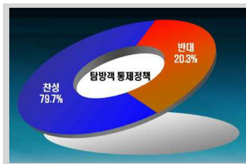
그림 5. 탐방객 통제정책 여론

본 조사에서는 탐방객 급증으로 인해 야기되는 혼잡 및 자연자원의 훼손 예방을 위해 일정수준 탐방객을 통제하는 것에 대한 탐방객 여론을 수렴하였다. 분석결과 탐방객 통제정책에 대해 찬성하는 비율이 79.7%, 반대하는 비율이 20.3%로, 엄정한 자원보전을 위한 탐방객 통제정책에 대해서는 긍정적 여론이 강한 것으로 분석되었다(그림 5). 탐방객 통제를 위한 정책수단으로는 ‘자연휴식년제’가 44.6%로 가장 높았으며 다음으로 ‘박물관, 휴양림, 수목원과 같이 특정일 휴식일제 도입’ 19.6%, ‘탐방예약제’ 15.8%, ‘혼잡정보 제공 등을 통한자율적 분산유도’ 12%, ‘성수기 시설 사용료 차등화’ 2.8% 순으로 나타났다(그림 6).