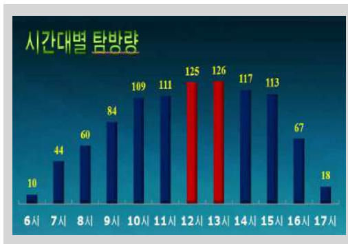
그림 3. 시간대별 탐방량

일반적으로 자원훼손의 직접적 영향은 탐방객 수가 아니라 성수기·주말 등 특정시기, 특정지역, 특정시간대 탐방집중현상이다. 따라서 국립공원 관리자가 자연, 역사, 문화, 휴양자원의 엄정한 보전과 양질의 탐방서비스를 제공하기 위해서는 단계별 수용력 관리정책 마련과 더불어 최대 혼잡지역에 대해서는 사회적 합의를 통한 탐방객 분산정책 도입이 필요하다.