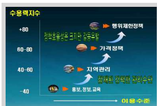
그림 11. 단계별 공원관리 전략