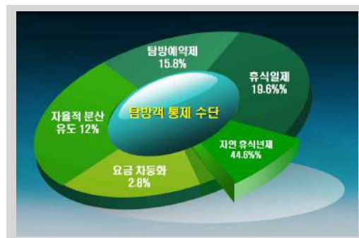
그림 6. 탐방객 통제 방법