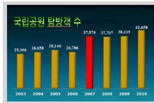
그림 2. 국립공원 탐방객 수(천명)

국립공원 탐방객 관리 측면에서 가장 어려운 딜레마는 탐방수요의 불균형, 즉 특정시기의 탐방집중현상을 어떻게 관리할 것인가의 문제이다. 왜냐하면 탐방집중현상, 경제학 개념으로 해석하면 순간적으로 공급이 수요를 충족시키지 못하는 경우 공원관리자나 탐방객 양측 모두에게 사회·경제적 비용 부담을 높이고 자연자원의 질 훼손과 혼잡으로 인한 탐방만족도의 질 저하를 야기하기 때문이다(김사헌, 2003). 결국, 국립공원 관리자는 공원 내 자연생태계, 역사·문화, 경관, 휴양자원의 훼손과 부정적 영향을 최소화하는 동시에 탐방객들에게 양질의 휴양경험을 제공할 수 있는 이용수준과 관리 전략을 마련해야 한다. 이를 위해서는 자연자원에 대한 면밀한 조사·모니터링뿐만 아니라 탐방객에 대한 사회과학적 분석, 즉 탐방객의 인구통계적·사회경제적 특성(visitor profile), 탐방 행태, 핵심 지역별 탐방집중도 및 이동경로, 탐방만족도, 혼잡도, 공원 환경 평가 등이 반드시 필요하다.