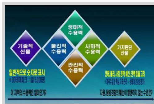
그림 8. 수용력 패러다임 변화

한편 과거 수용력 연구의 대부분은 탐방수요 증가가 자원의 질에 미치는 부정적인 영향을 단순 선형관계로 가정했지만, 실제 연구결과에서는 직접적 선형관계보다는 매개변수를 통한 간접적 관계로 나타났다. 이러한 선형