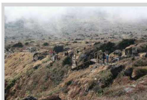
그림 10. 영실지역 탐방로

한라산국립공원 관리를 위한 단계별 관리전략은 그림 11, 표 6과 같이 교육/홍보/정보, 지역관리, 규칙/가격, 행위제한 정책 순으로 적용할 수 있다.