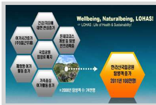
그림 1. 최근 사회환경 및 여가동향

국립공원은 우리나라의 자연생태계나 자연 및 문화경관을 대표하는 지역으로서 엄정한 자원보전과 지속가능한 이용을 도모하기 위해 지정된 곳이다(자연공원법 제1조). 그러나 2007년 국립공원 입장료 폐지, 주5일 근무제 정착에 따른 여가시간 증가, 국립공원을 비롯한 숲의 건강 및 치유기능에 대한 관심 증가(wellness, wellbeing, naturalbeing, slow life, LOHAS-Life of Health & Sustainability), 돈내코 코스 개방 등 탐방인프라 확충 등 탐방객 관리 패러다임 변화 및 탐방 인프라 확충, 가족중심 및 체험형 여가활동 증가 등 최근 사회 환경 변화로 인해 한라산국립공원을 포함한 우리나라 국립공원 탐방수요는 지속적으로 증가하고 있다(그림 1, 그림 2).