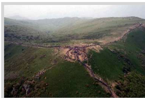
그림 7. 선형 관광 예(소백산)

왜냐하면 국립공원 내에서 수용력이란 단순히 하나의 숫자로 표시할 수 있는 기술적인 산물이 아니라 생태학적, 물리(시설)학적, 사회·심리학적 요인 조사와 공원 관리 계획 및 정책, 탐방객 의견, 자원 및 예산 범위 등을 고려한 가치판단의 산물(그림 8)로 보아야 하기 때문이다(신원섭, 1999, 국립공원연구원, 2007). 따라서 모든 각각의 상황에 따라 다른 이용수준이 결정되지 않는 한 수치화된 수용력 산정은 사실상 불가능하며 전 세계적으로도 야외 휴양지역을 대상으로 수용력을 산정한 사례는 전혀 없다. 결국 국립공원 관리자가 최우선적으로 고려해야 할 사항은 탐방객 수를 관리하는 것이 아니라 해당 지역의 적정 수용력을 결정하는 생태학적·물리(시설)학적, 사회·심리학적 지표와 평가기준(indicator & standard)을 관리하는 것이다. 다시 말해서 얼마만큼의 탐방객이 적절한 수준인가? 의 관점이 아니라 기후변화, 탐방수요, 이용행태, 탐방객의 시·공간적 분포, 대내·외 환경변화 등으로부터 야기되는 자원변화에 대한 구체적인 관리목표 설정과 모니터링을 통해 자원 및 탐방객 관리가 이루어져야 한다(Hammitt and Cole, 1987; Hendee et al. , 1990; Cole, 1994, 국립공원연구원, 2007).