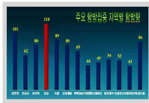
그림 4. 주요 탐방집중 지역별 탐방량

본 조사에서는 탐방객 급증으로 인해 야기되는 혼잡 및 자연자원의 훼손 예방을 위해 일정수준 탐방객을 통제하는 것에 대한 탐방객 여론을 수렴하였다. 분석결과 탐방객 통제정책에 대해 찬성하는 비율이 79.7%, 반대하는 비율이 20.3%로, 엄정한 자원보전을 위한 탐방객 통제정책에 대해서는 긍정적 여론이 강한 것으로 분석되었다(그림 5). 탐방객 통제를 위한 정책수단으로는 ‘자연휴식년제’가 44.6%로 가장 높았으며 다음으로 ‘박물관, 휴양림, 수목원과 같이 특정일 휴식일제 도입’ 19.6%, ‘탐방예약제’ 15.8%, ‘혼잡정보 제공 등을 통한자율적 분산유도’ 12%, ‘성수기 시설 사용료 차등화’ 2.8% 순으로 나타났다(그림 6).