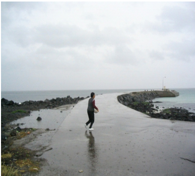
[사진 1] 씨앗을 뿌리는 잠수 (2008. 4.13, 잠수굿에서)