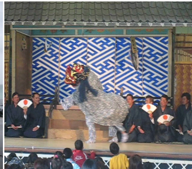
[사진 2] 춤추며 방어를 잡아먹는 사자 (2009.2.11, 토우시 마을 축제에서)