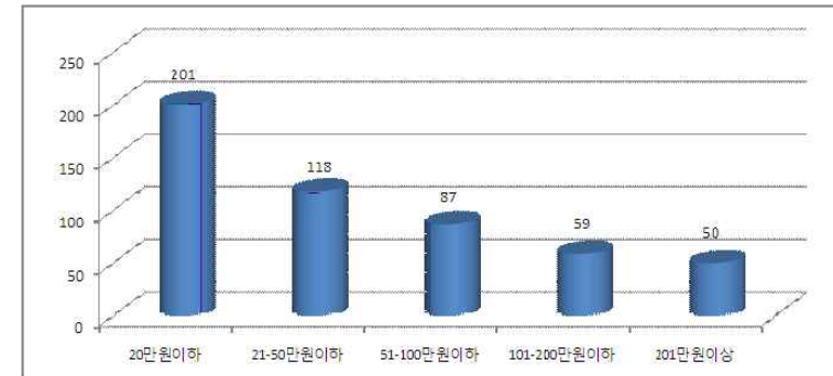
[그림 V-5] 1인당 총 소요 경비

주 1) 2009년 10월 30일(매매기준을 적용: 위안 173.4, 달러 1,184, 엔화 1,299)