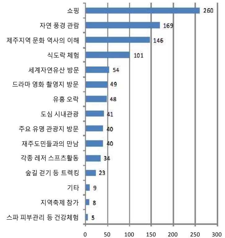
[그림 V-3] 만족활동

○ 제주 투어이후 만족한 관광활동에 대해서는 쇼핑이 260명으로 가장 높았으며, 그 다음으로는 자연풍경관람 169명, 제주지역문화 역사의 이해 146명, 식도락 체험 101명 등이 순으로 만족한 것으로 나타남.