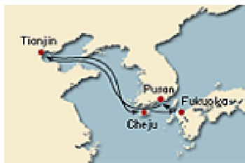
[그림 IV-5] 코스타 크루즈 제주기항 노선도(5)