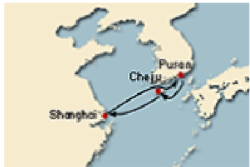
[그림 IV-7] 코스타 크루즈 제주기항 노선도(7)