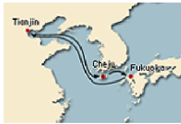
[그림 IV-4] 코스타 크루즈 제주기항 노선도(4)