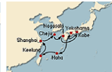
[그림 IV-1] 코스타 크루즈 제주기항 노선도(1) [그림 IV-2] 코스타 크루즈 제주기항 노선도(2)