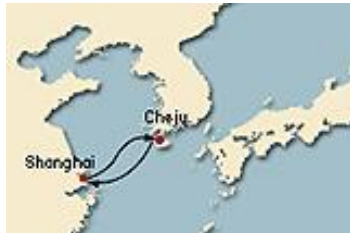
[그림 IV-6] 코스타 크루즈 제주기항 노선도(6)