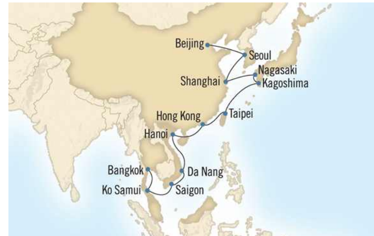
[그림 III-2] 오세아니아 크루즈사 노티카호 방콕-베이징 루트