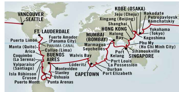
[그림 IV-8] 홀랜드 아메리카선사 암스테르담호 제주기항 노선도