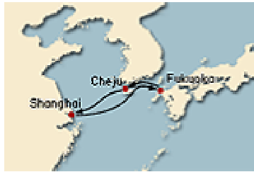
[그림 IV-3] 코스타 크루즈 제주기항 노선도(3)