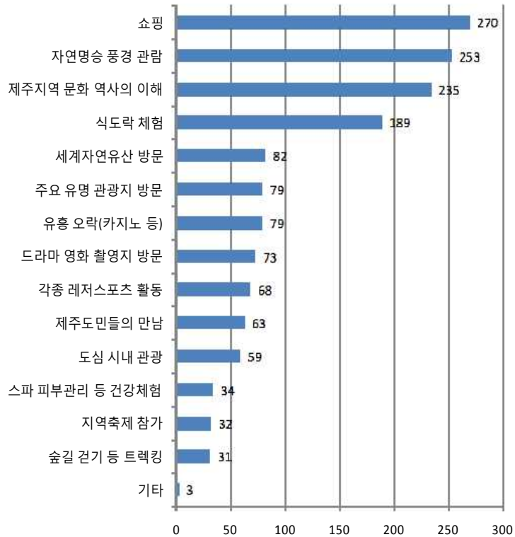
[그림 V-2] 기대활동

○ 제주 투어이후 만족한 관광활동에 대해서는 쇼핑이 260명으로 가장 높았으며, 그 다음으로는 자연풍경관람 169명, 제주지역문화 역사의 이해 146명, 식도락 체험 101명 등이 순으로 만족한 것으로 나타남.