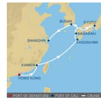
[그림 III-4] Azamara Quest호 제주기항 노선도 [그림 III-5] Azamara Quest호 부산기항 노선도