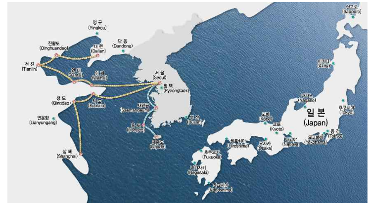
[그림 III-1] 서울특별시의 서해비단벨트 국제·국내 운항노선도(안)