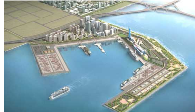
[그림 III-3] 인천신항 국제여객터미널 조감도

인천 아시안게임 이전에 준공을 목표로 사업을 추진할 계획이며, 총 6,000억 원의 사업비를 투입함. 28)