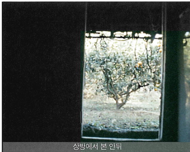
상방에서 본 안뒤

신인 밋칠성을 모셔놓는 신성한 곳으로 주거 규모의 대소를 막론하고 공통적으로 시설되어 있다. 이 곳은 안거리의 내부를 통과해야 하는 내밀한 곳이고 외부와는 특히 높게 쌓은 돌담으로