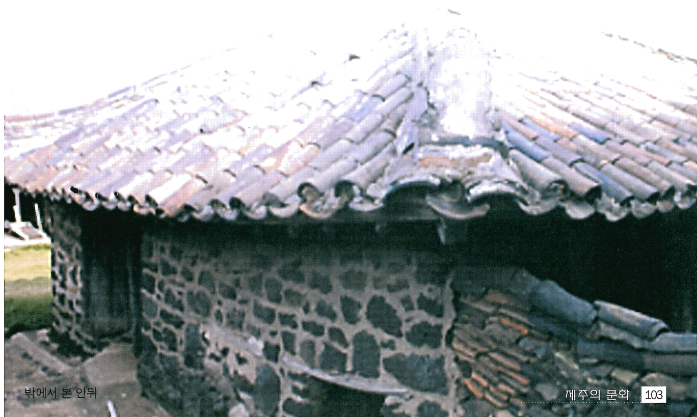
밖에서 본 안뒤