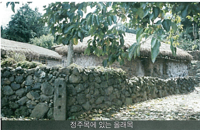
정주목에 있는 올래목