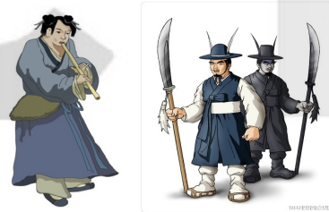
그림 3. 콘텐츠 진흥원(좌)과 문화원형백과(우)에 등장하는 ‘강림’ 이미지

주호민의 『신과 함께』나 에이원 엔터테인먼트의 <고스트 메신저>에 등장하는 ‘강림’의 캐릭터는 ‘신사’와 ‘미소년’으로 원전의 모습과 전혀 다르다. 문화원형백과와 문화콘텐츠진흥원에서 <차사본풀이>와 관련한 정보에 활용하고 있는 강림의 이미지와 비교해 보면 그 차이가 확연하다.