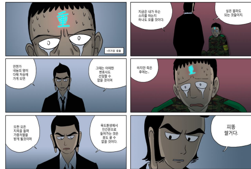
그림 1. 주호민, 신과함께, 애니박스, pp.17~18, 2012.

강림이 염라대왕의 명을 받아 잡으러 가는 동방삭은 인간세계의 질서를 어지럽히며 삼천년을 살아온 인물이다. 게다가 이미 여러 차사들을 보냈지만 번번이 실패한 거대한 대단한 능력의 소유자이다. 염라대왕의 명을 받은 강림은 지상에 내려와 솥을 씻는 묘책을 마련하여 동방삭을 잡아들이는데 성공한다. 염라대왕을 때려잡던 완력뿐만 아니라 지혜까지 겸비한 인물로서의 ‘강림’의 능력이 드러나는 대목이다.