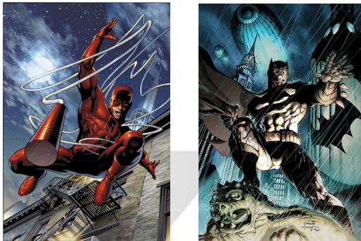
그림 4. 데어데블(左)과 배트맨(右)

론 악당들을 죽이기까지 한다. 그로인해 이들 다크 히어로들은 영웅이지만 그들이 속한 사회에서 환영받지 못한다. 2016년 개봉된 <배트맨 대 슈퍼맨:저스티스의 시작>에서 배트맨과 슈퍼맨이 서로 목숨 걸고 싸웠던 이유도 이들의 상반된 영웅 캐릭터 때문이었다. <차사본풀이> 속에 등장하는 ‘강림’도 영웅이지만 그가 속한 사회에서 환영받지 못한다는 측면에서 이들 다크히어로들과 닮아 있다.